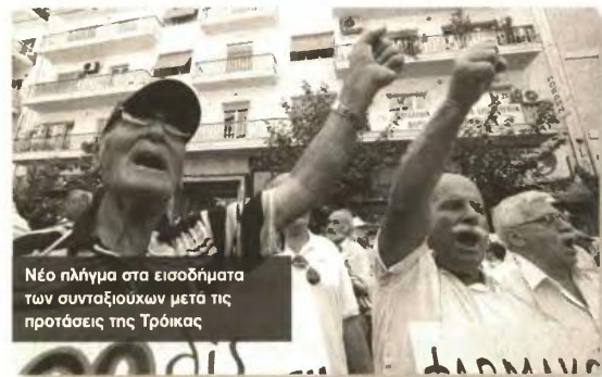
Νέο πλήγμα στα εισοδήματα των συνταξιούχων μετά τις προτάσεις της Τρόικας