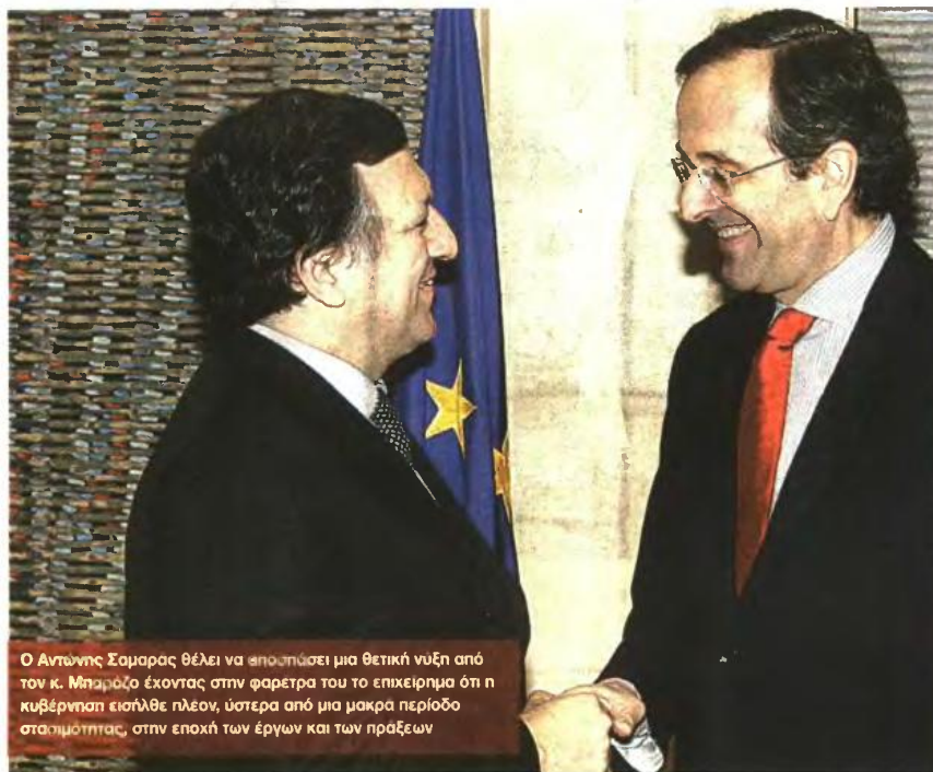
Ο Αντώνης Σαμαράς θέλει να αποσπάσει μια θετική νύξη από τον κ. Μπαρόζο έχοντας στην φαρέτρα του το επιχειρηματικό ότι η κυβέρνηση εισήλθε πλέον, ύστερα από μια μακρά περίοδο στασιμότητας, στην εποχή των έργων και των πράξεων

Ο πρωθυπουργός θα επιχειρήσει να κερδίσει την εύνοια του προ-