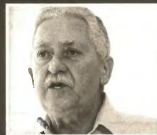
Εξαιρετικά δύσκολη αποδεικνύεται η συγκατοίκηση των τριών αρχηγών

Α ντιμέτωπη με τις προεκλογικές υποσχέσεις της βρίσκεται η κυβέρνηση, που προσπαθεί να μην περικόψει δαπάνες οι οποίες θα επιδεινώσουν την οικονομική κατάσταση εκατοντάδων χιλιάδων πολιτών και θα δημιουργήσουν αρνητικό αντίκτυπο για τον πρωθυπουργό Αντώνη Σαμαρά.