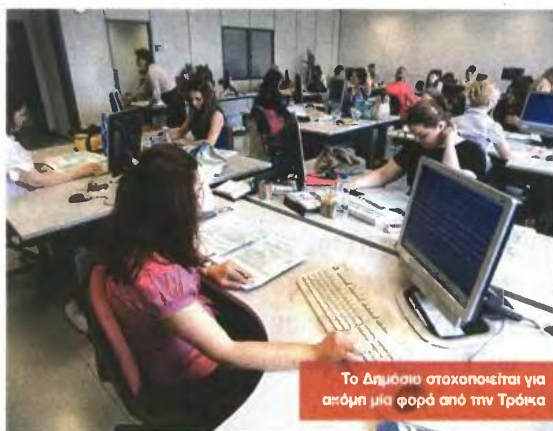
Το Δημόσιο στοχοποιείται για ακόμη μία φορά από την Τρόικα

Προβληματισμός στην κυβέρνηση, καθώς τα νέα μέτρα θα επιφέρουν όξυνση της ύφεσης