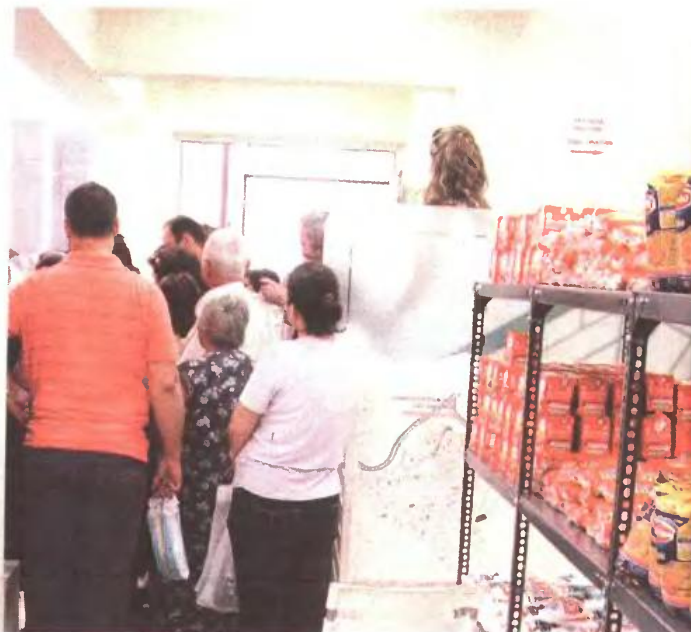
Συνταξιούχοι, μακροχρόνια άνεργοι, πολύτεκνες οικογένειες, ανασφάλιστοι και οικογενειάρχες με πολύ μικρά εισοδήματα επισκέπτονται σχεδόν καθημερινά τα κοινωνικά παντοπωτήρια κυρίως φαγητό.