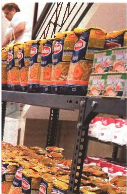
Λεία δώμων, ενοριών και οργανώσεων, αναζητούν τρόφιμα.