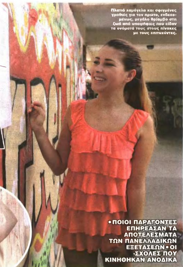
Πλατιά χαμόγελα και σφιγμένες γροθιές για τον πρώτο, ενδεχομένως, μεγάλο θρίαμβο στη ζωή από υποψήφιους που είδαν τα ονόματά τους στους πίνακες με τους επιτυχόντες.

Ειδικότερα, γενική άνοδος παρατηρείται στο 1ο επιστημονικό πεδίο (νομική, φιλολογίες, ψυχολογία, κοινωνιολογία κ.ά.), με εξαίρεση τα παιδαγωγικά τμήματα (δάσκαλοι) όπου σημειώνεται πτώση. Η Νομική Αθήνας ανέβηκε στα 18.879 μόρια (+271), ενώ ακόμη μεγαλύτερη άνοδο κατέγραψε η Νομική Κομοτηνής (+393, στα 18.276 μόρια). Στο 2ο επιστημονικό πεδίο η εικόνα είναι μικτή, αφού παρατηρείται άνοδος στα φυσικομαθηματικά τμήματα, καθώς και σε μερικά τμήματα χημείας, αλλά πτώση σε τμήματα βιολογίας και γεωλογίας. Ακόμη ψηλότερα, έστω με λίγα μόρια παραπάνω, βρέθηκαν οι ήδη υψηλόβαθμες σχολές του 3ου επιστημονικού πεδίου, δηλ. οι οδοντιατρικές, οι ιατρικές, οι φαρμακευτικές και οι νοσηλευτι-