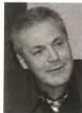
Γράφει ο Γ. Χατζητέγας Εκπαιδευτικός- φροντιστής

Επιλογή με κριτήριο την αγορά εργασίας και την παραμονή στην οικογενειακή εστία