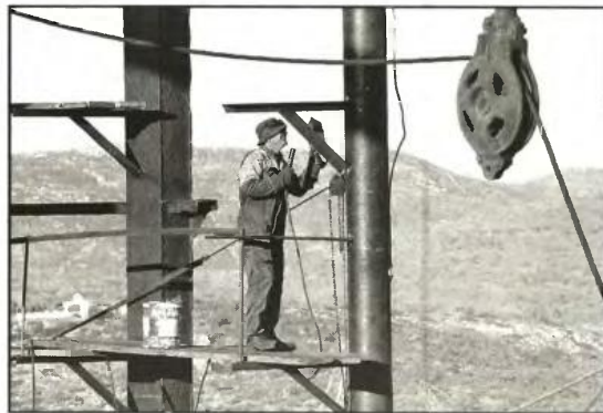
Η ανεργία τσακίζει τους εργατές στη Ναυπηγοεπισκευή. Στη φτώχεια τους θα προστεθεί και η κατάργηση του εποχιακού επιδόματος

Προς κατάργηση οδεύει το εποχιακό επίδομα σε μια σειρά κλάδους που εκτός από την ίδια τη φύση του επαγγέλματος, το βάθος της κρίσης ήρθε να δώσει τη «χαριστική βολή» μετατρέποντας το μεροκάματο σε «είδος προς εξαφάνιση». Πρόκειται για το εποχιακό επίδομα που χορηγείται στους οικοδόμους ύψους 678,06 ευρώ (εξαπάξ μια φορά το χρόνο). Στους εργαζόμενους στη Ναυπηγοεπισκευαστική Ζώνη, στους κτηνοτρόφους, στους δασοεργάτες, στους ρητινοσυλλέκτες, ύψους 641,41 ευρώ. Στους εργαζόμενους στα ξενοδοχεία και στον επισιτισμό, στους μουσικούς, στους τρα-