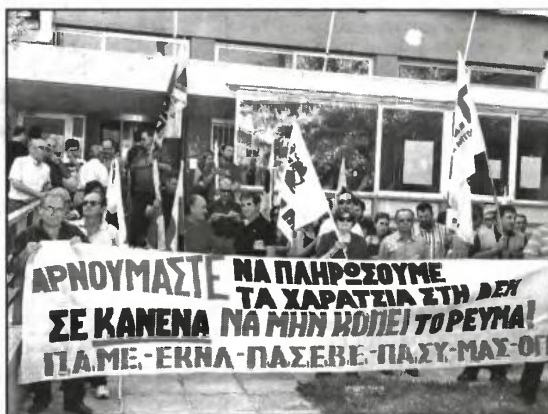
Αποψη από κινητοποίηση έξω από τα γραφεία της ΔΕΗ, τον περασμένο Ιούνιο

Στο μεταξύ, προκειμένου οι πονηροί κυβερνώντες να μπορούν να διαχειριστούν τη λαϊκή οργή, που θεωρείται αναμενόμενη, καθώς γνωρίζουν ότι το κόστος του ηλεκτρικού ρεύματος θα εκτιναχθεί για τα νοικοκυριά, εξετάζουν διάφορα κόλπα. Ηδη σε πολλές περιπτώσεις μιλούμε μόνο για την αύξηση του ηλεκτρικού ρεύματος, την ίδια στιγμή που η Ρυθμιστική Αρχή Ενέργειας (ΡΑΕ) αναπροσαρμόζει και τις επιμέρους χρεώσεις των δικτύων Μεταφοράς και Διανομής, αλλά και τις χρεώσεις ΥΚΩ (Υπηρεσίες Κοινής Ωφέλειας), τις οποίες όμως δεν τις «μετρούν» ως αύξηση του ηλεκτρικού τιμήματος! Έχουν φροντίσει όμως, πέρα από τις ετήσιες ποσοστιαίες αυξήσεις γι' αυτές τις χρεώσεις, να τις συνδέσουν και με το ποσό που ορίζεται για το ηλεκτρικό ρεύμα. Το αποτέλεσμα είναι πολλοί καταναλωτές να φριξούν τους προηγούμενους μήνες αντικρίζο-