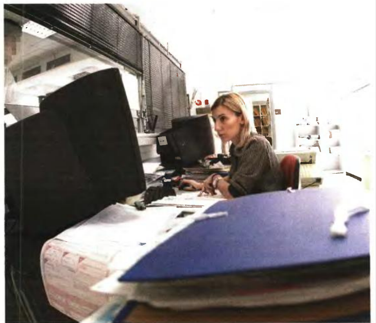
Βαριά θα είναι η «κεραμίδα» για τους μισθούτους και τους συνταξιούχους λόγω της κατάργησης του αφορολόγητου για όσους έχουν παιδιά

Εναλλακτικά εξετάζεται η θέσπιση ενός μικρού επιδόματος για όλες τις κατηγορίες αναπήρων, προκειμένου να μετριαστεί η επιβάρυνσή τους.