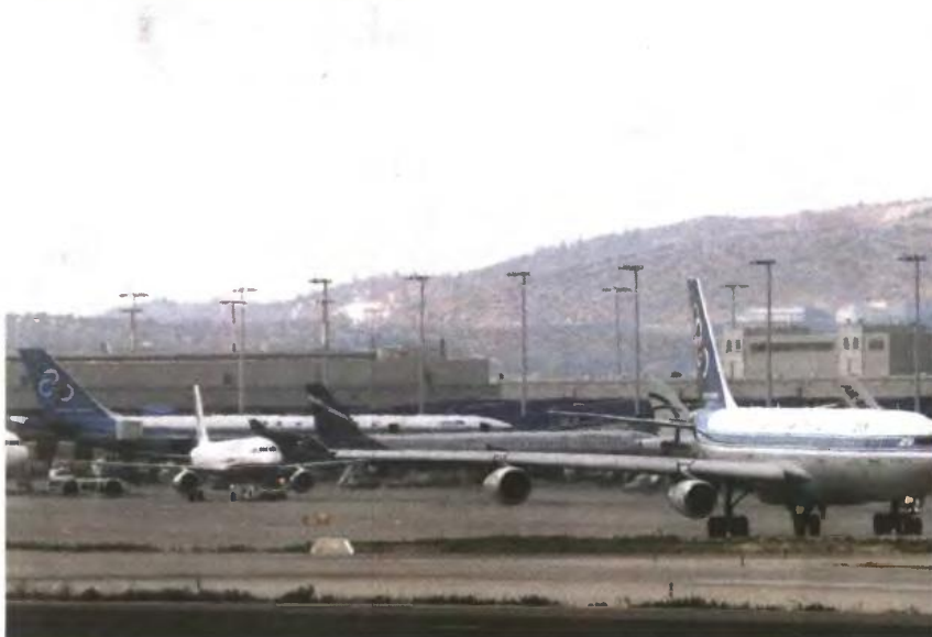
ΑΕΡΟΠΟΡΙΚΕΣ ΑΦΙΞΕΙΣ ΠΡΩΤΟΥ ΕΞΑΜΗΝΟΥ 2012 ΣΕ ΣΥΓΚΡΙΣΗ ΜΕ ΠΡΩΤΟ ΕΞΑΜΗΝΟ 2011

Η πορεία των αφίξεων ξένων τουριστών παραμένει αρνητική, όμως τελευταία στοιχεία δείχνουν πως υπάρχει μια ελαφρά βελτίωση, έτσι ώστε να είναι πιθανό να κλείσει η χρονιά με απώλειες μικρότερες των αρχικών αναμενομένων.