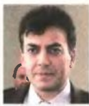
Ο νέος υπουργός Εργασίας, Γιάννης Βρούτσης, υποσχεται επαναφορά του Προγράμματος Κοινωνικού Τουρισμού από την επόμενη χρονιά.

■ Το νέο πρόγραμμα θα «τρέξει» από το φετινό Αύγουστο έως τον Μάιο του 2013.