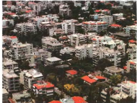
Η ΓΠΠΣ θα επιδιώξει να προετοιμάσει την αποστολή των εκκαθαριστικών σημειωμάτων του Φόρου Ακίνητης Περιουσίας των ετών 2010 και 2011 μέχρι το τέλος Αυγούστου.