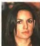
Η υπουργός Τουρισμού, Ολγα Κεφαλογιάννη, ανακοίνωσε ότι το «Τουρισμός για όλους» περιλαμβάνει τα υποπρογράμματα εξαήμερων διακοπών.

Το όριο του εισοδήματος για μεμονωμένους δικαιούχους είναι ατομικό εισόδημα 18.000 ευρώ, για δικαιούχους με οικογενειακό εισόδημα 31.000 ευρώ και για τριτέκνους με οικογενειακό εισόδημα 40.000 ευρώ. Για κάθε προστατευόμενο τέκνο το εισόδημα προσαρξάνεται κατά 1.500 ευρώ.