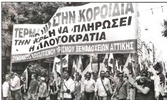
Το σύνολο των περικοπών και μέτρων έχουν στόχο να σώσουν την πλουτοκρατία με το λαό πτωχευμένο

Για σήμερα, Τρίτη, έχουν προγραμματιστεί ανάλογες συναντήσεις με το υπουργείο Εργασίας, που διαχειρίζεται βασικό κομμάτι της αντιλαϊκής επίθεσης και επίσης με την Τράπεζα της Ελλάδας για τη διοχέτευση του προβλεπόμενου πακτωλού με τις διακρατικές ενισχύσεις στις