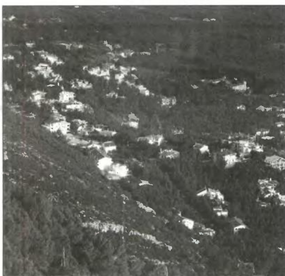
βουλίου της Επικρατείας.

Πρόκειται για μια επιβεβλημένη κίνηση αν αναλογιστεί κανείς ότι οι 415.000 αιτήσεις που έχουν κατατεθεί μέχρι στιγμής, είναι δυσανάλογες των υψηλών προσδοκιών του υπουργείου Περιβάλλοντος