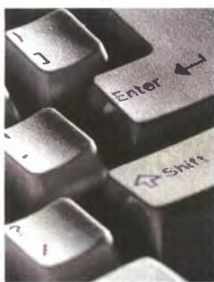
Η ηλεκτρονική πύλη θα ανοίξει για λίγους μήνες, προκειμένου οι φορολογούμενοι να δηλώσουν τα ακίνητά τους.