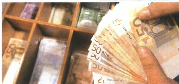
Τόκοι καταθέσεων, ενοίκια και υπεραξίες από πωλήσεις ακινήτων και μετοχών θα φορολογούνται με συντελεστή που θα κυμαίνεται από 15% έως 20%.

• Επίσης η συγκεκριμένη αναφορά στο μνημόνιο προοιωνίζεται κατάργηση της απαλλαγής από τη φορολογία των κοινωνικών επιδομάτων όπως το ΕΚΑΣ, το επίδομα ανεργίας, τα πολιτευτικά επίδοματα και τις συντάξεις και άλλες ενισχύσεις. • Επιβολή ενιαίου φορολογικού συντελεστή στις επιχειρήσεις και εξίσωσή του με τον νέο ανώτατο φορολογικό συντελεστή 35% της κλίμακας φορολογίας εισοδήματος φυσικών προσώπων.