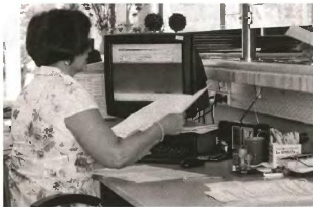
Η γυναίκα εργάζεται στο Δημόσιο και έχει 50 χρόνια υπηρεσίας.

Α Με εξαγορά σπουδών και τέκνου (5 έτη) συμπληρώνετε 25ετία το 2011 και κατοχυρώνετε για να φύγετε ως πατέρας ανηλίκου από το Δημόσιο στα 52 σας. Από το ΤΣΜΕΔΕ θα λάβετε σύνταξη στα 60 με συνολικά 40 έτη ή στα 65.