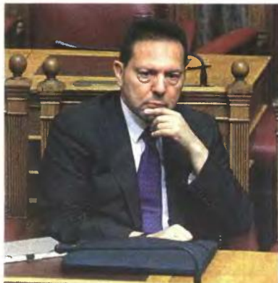
Ο υπουργός Οικονομικών Γιάννης Στουρνάρας εκτίμησε ότι η τελική συμφωνία με τους δανειστές μας θα «κλειδώσει» την προσεχή εβδομάδα.

Η ελληνική πλευρά θέλει να συνεχιστεί το καθεστώς που ούτως ή άλλως ισχύει σήμερα (με το δεύτερο Μνημόνιο) μέχρι το 2016. Είναι πάντως ανοικτό το ενδεχόμενο τον Απρίλιο, οπότε και θα υπάρξει νέος τρόπος καθορισμού του κατώτατου μισθού, να ζητηθεί η τοποθέτηση των κοινωνικών