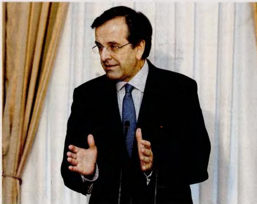
Ο πρωθυπουργός Αντ. Σαμαράς ζήτησε, σύμφωνα με πληροφορίες, να αποφευχθεί η περικοπή των 30 ευρώ στις συντάξεις του ΟΓΑ και να προστατευθούν οι πολύ χαμηλές συντάξεις.

Ο κ. Σαμαράς ζήτησε να μάθει τις τελευταίες εξελίξεις επί των διαπραγματεύσεων, άλλωστε διατηρεί συνεχή επικοινωνία με το οικονομικό επιτελείο, ενώ ετέθησαν επί κάρτου οι βασικές προτεραιότητες της ελληνικής πλευράς, μετά και τις πρώτες παρατηρήσεις των εκπροσώπων της τρόικας για τους άξονες των