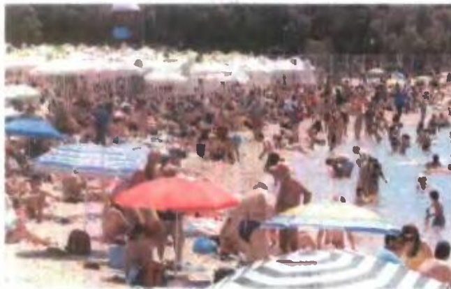
Το πρόγραμμα του ΕΟΤ «Τουρισμός για όλους» θα διαρκέσει έως τις 31 Μαρτίου.