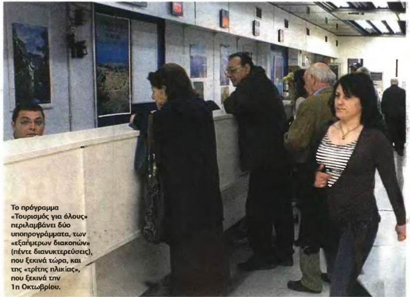
Το πρόγραμμα «Τουρισμός για όλους» περιλαμβάνει δύο υποπρογράμματα, των «εξαήμερων διακοπών» (πέντε διανυκτερεύσεις), που ξεκινά τώρα, και της «τρίτης ηλικίας», που ξεκινά την 1η Οκτωβρίου.

• Τρίτεκνοι με οικογενειακό εισόδημα 40.000,00 € • Για κάθε προστατευόμενο τέκνο το εισόδημα προσαυξάνεται κατά 1.500 €. Στην περίπτωση του οικογενειακού εισοδήματος τα έσοδα υπολογίζονται αθροιστικά από το σύνολο των μελών της οικογένειας, ανεξάρτητα αν είναι δικαιούχοι ή μη του προγράμματος. Δεν υπολογίζονται ως πηγή εισοδημάτων τα ακαθάριστα έσοδα των επιχειρήσεων. Οι δικαιούχοι, προκειμένου να λάβουν τα δελτία, θα πρέπει να προσκομίσουν στα ΚΕΠ φωτοαντίγραφο εκκαθαριστικού σημειώματος του έτους 2011 ή φωτοαντίγραφο της φορολογικής δήλωσης του έτους 2012 για όσους έκαναν για πρώτη φορά φορολογική δήλωση το 2012, καθώς και φωτοαντίγραφο αστυνομικής ταυτότητας και βιβλιαρίων ασθενείας.