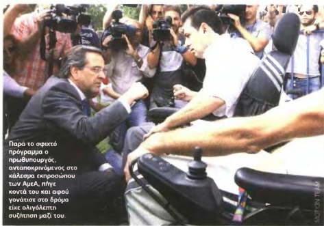
Παρά το σφιχτό πρόγραμμα ο πρωθυπουργός, απεσπασμένος στο «άλλαγμα εκπροσώπων των ΑμεΑ, πήγε κοντά του και αφού γονάτισε στα έρμια είχε ολιγόλεπτο συζήτηση μαζί του.

Μ ήνυμα αισιοδοξίας προς τον ελληνικό λαό απέστειλε από τη Θεσσαλονίκη ο Αντώνης Σαμαράς. Κατά τη διάρκεια της σημερινής τελετής των εγκαινίων της 77ης ΔΕΘ, η οποία πραγματοποιήθηκε προξέθετο το πρωί στην αίθουσα «Κορόνα» του εκθεσιακού κέντρου, ο πρωθυπουργός τόνισε πως η Ελλάδα θα ξεπεράσει την κρίση. «Όσο εμπέδουμε ενωμένοι τα διεθνώς κλίμα θα συνεχίσει να γυρίζει ακόμα περισσότερο υπέρ μας. Το μόνο που μας ζητώ είναι να πιστέψουμε στον εαυτό μας, να πιστέψουμε όλους ο ελληνικός λαός στη δύναμή του», είπε χαρακτηριστικά.