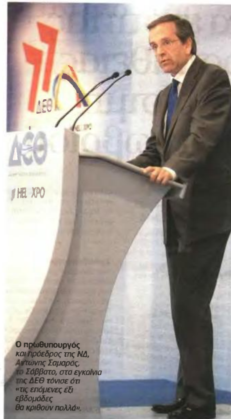
Ο πρωθυπουργός και πρόεδρος της ΝΔ, Αντώνης Σαμαράς, το Σάββατο, στα εγκαίνια της ΔΕΘ τόνισε ότι «τις επόμενες εβδομάδες θα κριθουν πολλά».