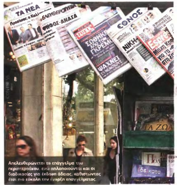
Απελευθερώνεται το επάγγελμα του περιπτερούκου, ενώ απλοποιούνται και οι διαδικασίες για έκδοση άδειας, καθιστώντας έτσι πιο εύκολη την έναρξη επαγγέλματος.

Στην εκμετάλλευση περιπτέρων, καταργούνται οι περιορισμοί της μόνιμης κατοικίας των δικαιούκων άδειας, ο περιορισμός στον αριθμό των αδειών εκμετάλλευσης περιπτέρων με βάση πληθυσμιακά κριτήρια, η ύπαρξη περιορισμένου αριθμού προσώπων που δικαιούνται να εκμεταλλεύονται τα περίπτερα (μπορούν πλέον και νομικά πρόσωπα) και ο περιορισμός της μόνιμης κατοικίας του ενδιαφερόμενου. ■