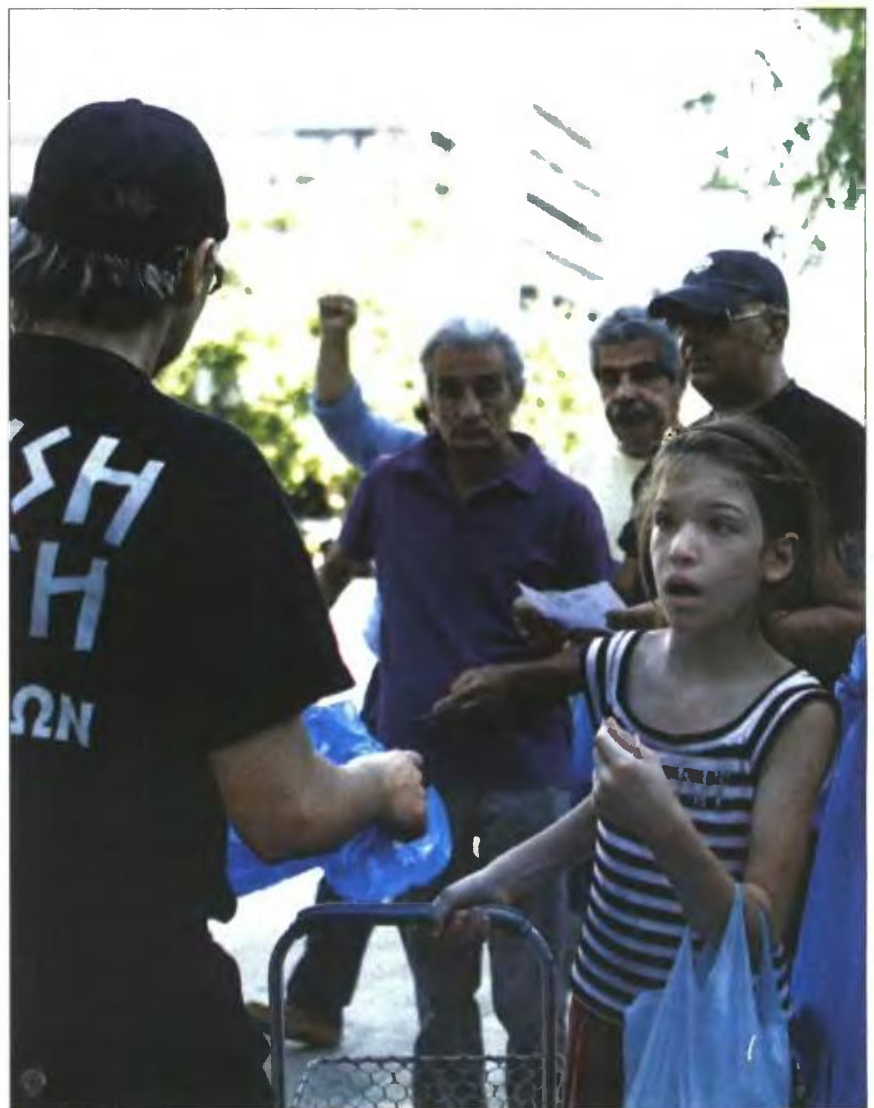
Βουλευτές και μέλη της Χρυσής Αυγής μοιράζουν τρόφιμα σε Έλληνες στην πλατεία Συντάγματος

Σε ανακοίνωσή της η Χρυσή Αυγή επιτέθηκε στον δήμαρχο Αθηναίων Γιώργο Καμίνη, αναφέροντας ότι «η απάντηση δόθηκε από τα στόματα χιλιάδων Ελλήνων που παρέλαβαν σήμερα, δωρεάν, τόνους ελληνικών τροφίμων και ταυτόχρονα αποδοκίμασαν έντονα τη δημοτική αρχή».