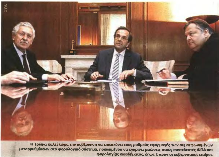
Η Τρίκα καλεί τώρα την κυβέρνηση να επιταχύνει τους ρυθμούς εφαρμογής των συμφωνημένων μεταρρυθμίσεων στο φορολογικό σύστημα, προκειμένου να εγκρίνει μειώσεις στους συντελεστές ΦΠΑ και φορολογίας εισοδήματος, όπως ζητούν οι κυβερνητικοί εταίροι.

μεθόδους κατά του ξεπλύματος βρόμικου χρήματος. Η πρόδος στους τομείς αυτούς πρέπει να παρακολουθείται από ποσοτικούς δείκτες (βασιικούς δείκτες απόδοσης), σύμφωνα προς τους στόχους που έχουν τεθεί βάσει του σχεδίου κατά της φοροδιαφυγής. Με βάση τους δείκτες αυτούς, πρέπει να διενεργηθεί συγκεκριμένος αριθμός ελέγχων: