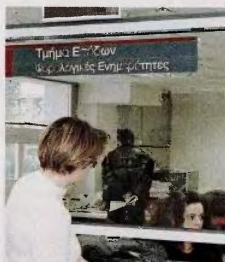
Θα εξεταστεί αύξηση του αφορολόγητου από τις 5.000 ευρώ στις 8.000.

1. Κατάρτιση φοροαπαλλαγών και προτιμιασικών καθεστώτων και αντικατάστασή τους από ειδικές - στοχευμένες επιδοτήσεις. Σύμφωνα με την πρόταση που υπάρχει και που έχει συνταχθεί από κλιμάκιο της τρόικας θα πρέπει άμεσα να καταργηθούν τα πρόσθετα αφορολόγητα ποσά για ανάπαιρους, για έχοντες 1 ή 2 προστατευόμενα παιδιά, τρι-