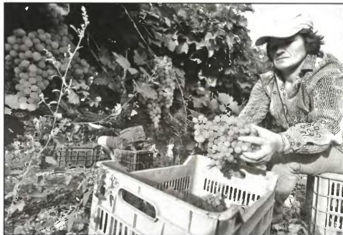
Η ΟΓΕ καλεί τις αγρότισσες σε πάλη για τις ανάγκες τους

Ερχονται τώρα με το κόψιμο κι αυτού του επιδόματος ουσιαστικά ελεημοσύνης που την ονόμαζαν αγροτική σύνταξη να την εξαθλιώσουν κυριολεκτικά. Μια σύνταξη που την παίρνει στα 65 χρόνια της, αν και το αγροτικό επάγγελμα θεωρείται από τα πιο βαριά και ανθυγιεινά, ιδιαίτερα για τις γυναίκες αγρότισσες, εξαιτίας του αναπαραγωγικού τους ρόλου. Να σημειωθεί ακόμα ότι η θέση των αγροτισσών επιδεινώνεται από την έλλειψη βασικών κοινωνικών υποδομών και υπηρεσιών που γίνεται πιο έντονη, εξαιτίας της καπιταλιστικής κρίσης (έλλειψη βρεφονηπιακών σταθμών, κλείσιμο σχολείων, φροντίδα ηλι-