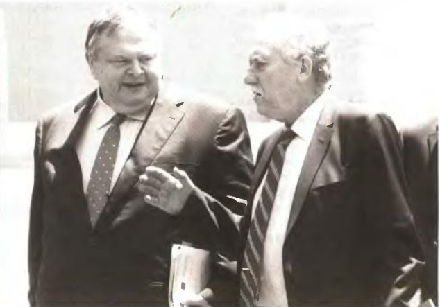
Μετά από τόσες συσκέψεις της ελληνικής τριάδας, το μόνο αναπτυξιακό μέτρο ήταν η μείωση της φορολογίας των πλούσιων.

«Δυστυχώς οι πολύτεκνοι βάλλονται από τη σημερινή κυβέρνηση πάρα πολύ. Ενώ η ΝΔ προεκλογικά και δια στόματος του Αντώνη Σαμαρά είχε κάνει το Δημογραφικό σημεία και μία από τις δεσμεύσεις έκανε λόγο για επαναφορά των πολυτεκνικών επιδομάτων στην προ του 2009 κατάσταση, τίποτα τελικά από εκείνα δεν τηρείται.