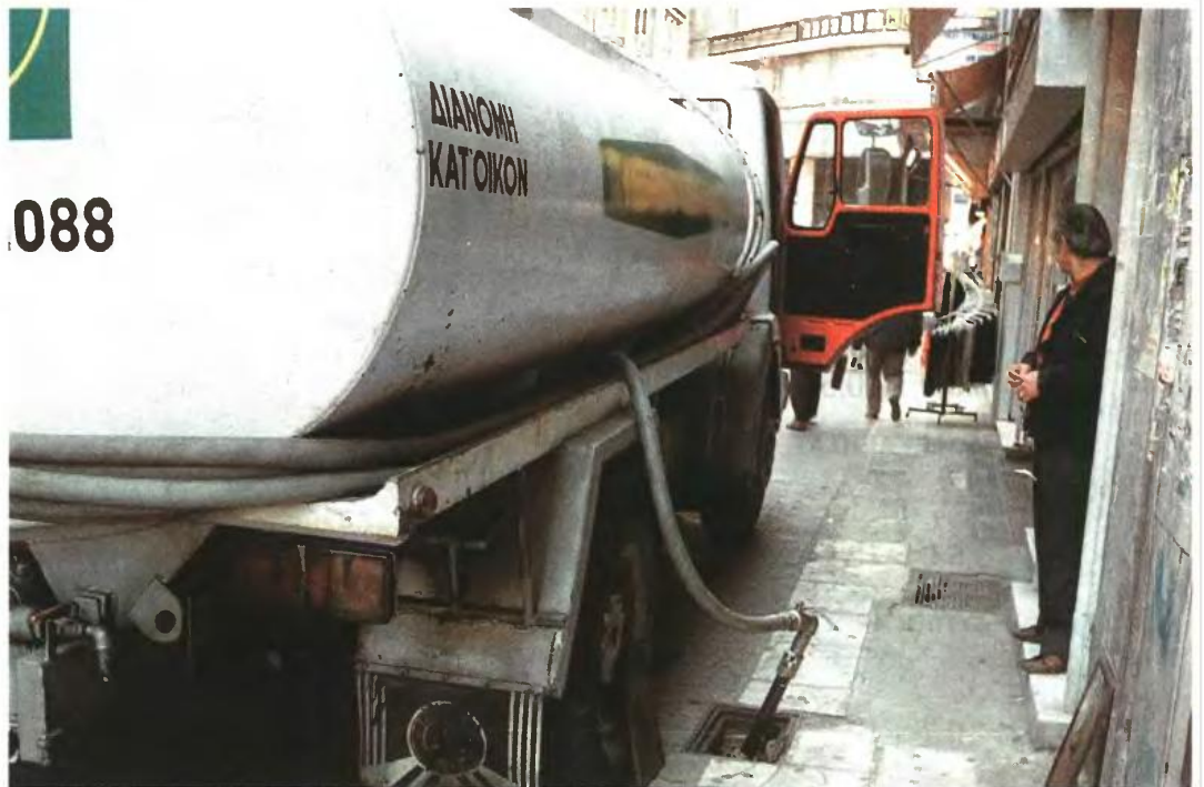
Στα ύψη θα φθάσει η τιμή του πετρελαίου θέρμανσης μετά την εξίσωση της τιμής του με το πετρέλαιο κίνησης. Φωτογραφία από διανομή πετρελαίου σε πολυκατοικία

Π έριστοι οι λογαριασμοί της ΔΕΗ φούσκωσαν επικίνδυνα τόσο για τα νοικοκυριά όσο και για την ίδια την επιχείρηση που είδε τους ανεξόφλητους λογαριασμούς να εκτοξεύονται στα ύψη. Φέτος, το οικονομικό επιτελείο της κυβέρνησης από τη μία πλευρά εξετάζει την αποσύνδεση του τέλους ακινήτων από τους λογαριασμούς του ηλεκτρικού ρεύματος και από την άλλη μελετά το ενδεχόμενο να καταβάλλει ακριβώς μέσω των λογαριασμών αυτών το επίδομα θέρμανσης που έχει προαναγγείλει μετά την προγραμματισμένη εξίσωση των ειδικών φόρων κατανάλωσης σε