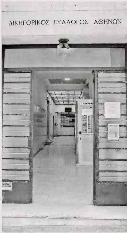
Σύμφωνα με το πολυνομοσχέδιο, η σύμπραξη δικηγόρου απαιτείται για τον αγοραστή όταν το αγοραπωλητήριο συμβόλαιο υπερβαίνει τις 60.000 ευρώ για τους Δικηγορικούς Συλλόγους Αθηνών και Πειραιώς.

Πόροι του ΤΕΕ Οσον αφορά τους μηχανικούς, στο σχέδιο επαναφέρεται διάταξη που είχε καταψηφιστεί την προηγούμενη εβδομάδα και αφορά την κατάργηση δύο πόρων του ΤΕΕ. Πιο συγκεκριμένα, καταργείται η εισφορά 2% από τη νόμιμη αμοιβή του μηχανικού υπέρ ΤΕΕ, καθώς και το 2% εκ του προϋπολογισμού κάθε δημοσίου έργου, που επίσης αποδιδόταν στον τεχνικό σύμβουλο του κράτους. Η κατάργηση των δύο πόρων έχει προκαλέσει την οξεία αντίδραση του ΤΕΕ, που υποστηρίζει ότι οδηγείται με μαθηματική ακρίβεια σε «λουκέτο».