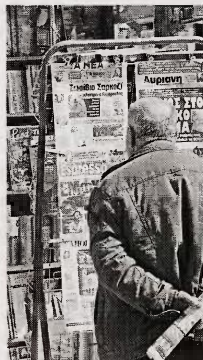
Πλήρως απελευθερώνεται και η πώληση των εφημερίδων.

• Φορτοεκφορτωτές: επιτρέπεται η πρόσβαση σε όλους, καταργείται η κρατική παρέμβαση