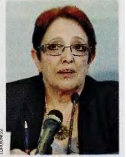
Η γ.γ. του ΚΚΕ, Αλέκα Παπαρήγα.

Το ΚΚΕ επικρίνει να υπερκεράσει όποιες άλλες προτάσεις αντιπαραθέσει με την κυβέρνηση και τη μνημονιακή πολιτική, τις οποίες αποζηνιάζει ως εντός των τεχνών. «Καλούμε τον λαό να προχωρήσει σε συστηματικά και καλά οργανωμένα απειθαρκία και ανυπακοή, όχι μόνο στις αποφάσεις της κυβέρνησης, αλλά γενικότερα στο σύστημα. Αυτή είναι η καλή αρχή για να οργανωθεί η αντίθεση που πρέπει να καταδείξει στην κατάργηση των μονοπωλίων, στην απειμολογία από τις δεσμεύσεις της Ε.Ε., διαδοχά την αποδέσμευση. Οποιαδήποτε άλλη λύση που προτείνεται είναι εντός των τεχνών», είπε χθες η κ. Παπαρήγα. Το ΚΚΕ είχε προχωρήσει τις προηγούμενες ημέρες σε ισχυρή κινητοποίηση, χαρακτηρίζοντας τη συμμετοχή των εργαζομένων, των ανέργων και των λαϊκών στραμάτων στις απεργιακές συγκεντρώσεις «καθίκον για να ασκηθεί η μέγιστη λαϊκή πίεση για να μην ψηφιστούν τα μέτρα». Ταυτόχρονα, ο Περιοσός οξύνει την αντιπαράθεση με τον ΣΥΡΙΖΑ, όπως έδειξε η αντίθεση στην πρόταση Τσίπρα για εκλογές. «Ο ΣΥΡΙΖΑ ζητάει εκλογές προτού προλάβει το κίνημα να οργανωθεί και ξεσκεπαστεί ο πραγματικός χαρακτήρας της δικής του πολιτικής, που είναι πολιτική διαχείρισης της κρίσης σε βάρος του λαού».