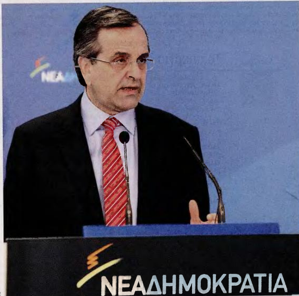
Ο πρωθυπουργός κ. Αντ. Σαμαράς προσέρχεται στη σημερινή ψηφοφορία με τη βεβαιότητα ότι ο επώδυνος σχεδιασμός των προηγούμενων μηνών θα ολοκληρωθεί με επιτυχία.

Η σημερινή ψηφοφορία προκάλεσε την παρέμβαση παλαιότερων και πρώην στελεχών του ΠΑΣΟΚ. Ο κ. Χ. Καστανίδης με ανακοινωσό του κάλεσε τους βουλευτές του κόμματος να καταψηφίσουν, ενώ με δηλώσεις του στη Frankfurter Allgemeine Zeitung ο κ. Γ. Ρεγκούσις εκτίμησε ότι η κυβέρνηση Σαμαρά «γρήγορα θα διαλυθεί».