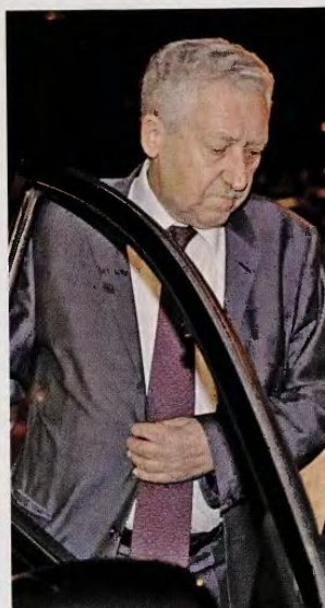
Την επίσημη γραμμή της ΔΗΜΑΡ και του κ. Φ. Κουρέλη, το «παρών», είναι αμφίβολο αν θα τηρήσουν και οι 15 βουλευτές του κόμματος.