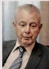
Ο τέως πρωθυπουργός κ. Παν. Πικραμμένος.

Ο κ. Πικραμμένος περιέγραψε το νέο περιβάλλον το οποίο διαμορφώνεται για το ΣτΕ ως συνέπεια της οικονομικής κρίσης και των μέτρων που ελήφθησαν για την αντιμετώπιση της, για να θέσει το ερώτημα: «Μπορεί το δικαστήριο να αντιμετωπίσει την κατάσταση με τις υπάρχουσες δομές». Ποια είναι η κατάσταση; Όπως χαρακτηριστικά ανέφερε, όταν ο ίδιος αποχώρησε από το ΣτΕ, αυτό είχε κατακλυστεί από υποθέσεις σχετικές με τα μέτρα για την αντιμετώπιση της κρίσης. Για παράδειγμα, είχαν κατατεθεί περισσότερες από 200 προσφυγές κατά του ΠΣΙ και μεγάλος αριθμός υποθέσεων κατά του δεύτερου Μνημονίου, κατά των έκτακτων εισοφορών, κατά ρυθμίσεων όπως η εφεδρεία κ.λπ. Την προγενέστερη περίοδο, δε, το ΣτΕ κλήθηκε να αποφασίσει επίσης επί σημαντικών υποθέσεων και πάλι σε σχέση με τα μέτρα για την αντιμετώπιση της κρίσης, όπως η απόφαση για τη συνταγματικότητα περί κλειστού επαγγελματός ιδιοκτητή βυτιοφόρου φορτηγού, για το ωράριο των φαρμακείων, για το πρώτο Μνημόνιο κ.ά.