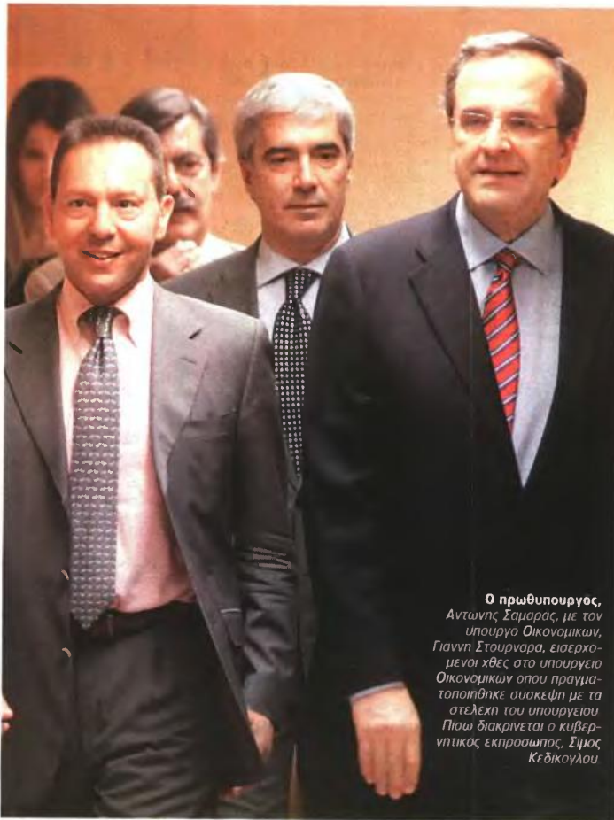
Ο πρωθυπουργός, Αντώνης Σαμαράς, με τον υπουργό Οικονομικών, Γιάννη Στουρνάρα, εισερχόμενοι χθες στο υπουργείο Οικονομικών όπου πραγματοποιήθηκε συσκέψη με τα στελέχη του υπουργείου. Πίσω διακρίνεται ο κυβερνητικός εκπρόσωπος, Σίμος Κεδίκογλου

Στον ευρύτερο δημόσιο τομέα αναμένονται και νέες περικοπές στους Οργανισμούς Τοπικής Αυτοδιοίκησης μέχρι του σημείου του να φτάσει η περικοπή το 1 δισ. ευρώ όπως ήταν από την αρχή προγραμματισμένο από το σχέδιο «Καλλικράτης». Υπενθυ-