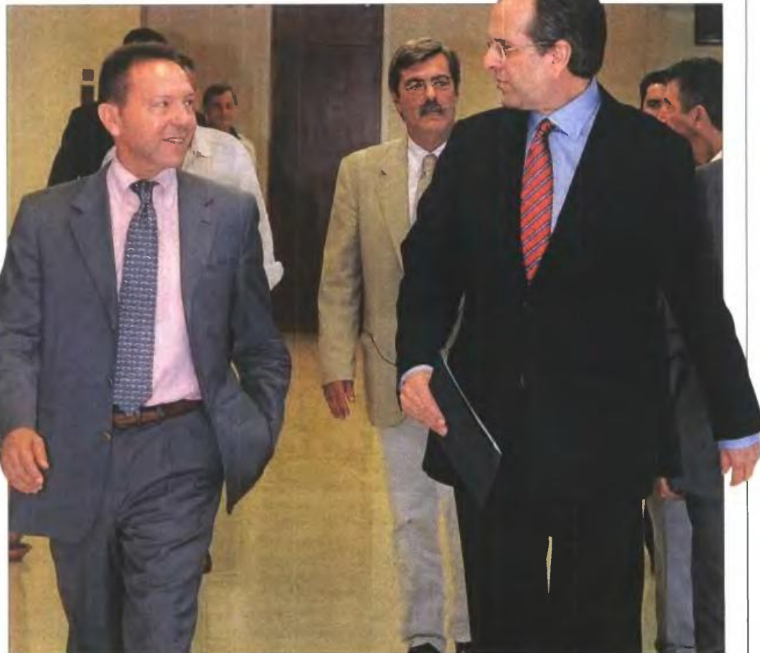
▲ Ο πρωθυπουργός Αντώνης Σαμαράς με τον υπουργό Οικονομικών Γιάννη Στουρνάρα λίγο πριν από τη χθεσινή συνάντηση για την εξειδίκευση των μέτρων

Ορισω ως «αντίπαλο» την ανεργία και είπε ότι η κυβέρνηση εξετάζει τα πάντα, αλλά δεν θα προ-