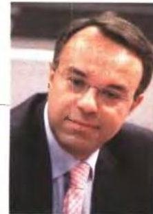
Χρήστος Σταϊκούρας, αναπληρωτής υπουργός Οικονομικών: Θέλω να πιστεύω ότι δεν θα υπάρχουν για φέτος πρόσθετα μέτρα.

Οι αλλαγές στις αμοιβές θα καταργήσουν κεκτημένα, σύμφωνα με τα οποία υπερωρίες και άλλες εξτρα αμοιβές των εργαζομένων σε δημόσιες εταιρείες έχουν ενσωματωθεί στους μισθούς. Σε μέσα επίπεδα, αν εφαρμοστεί ένα μισθολόγιο ανάλογο αυτού της κεντρικής διοίκησης, οι μειώσεις εκτιμάται ότι θα προσεγγίσουν, και σε κάποιες περιπτώσεις θα ξεπεράσουν, το 30-35%.