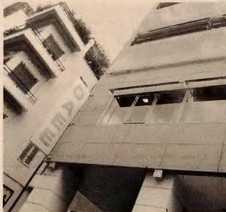
Στο μικροσκόπιο ελέγχου 6.636 συνταξιούχοι του ΟΑΕΕ, οι οποίοι δεν δήλωναν το σύνολο ή μέρος των εισοδημάτων τους από συντάξεις.