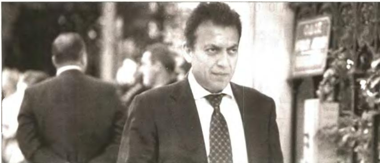
Εκτός από το τεσκούρεμα στο εφάπαξ της τάξης του 22,6% που καταβάλλει το Ταμείο Πρόνοιας των Δημοσίων Υπαλλήλων, οι μειώσεις, σε κάποια από τα Ταμεία τα οποία χορηγούν υψηλό εφάπαξ, θα φτάσουν στο 40%, ενώ θα γίνει και σύνδεση του εφάπαξ με τις εισφορές που καταβάλλονται

ΤΣΕΚΟΥΡΕΜΑ ΚΑΙ ΣΤΟΥΣ ΜΙΣΘΟΥΣ ΤΟΥ ΙΔΙΩΤΙΚΟΥ ΤΟΜΕΑ