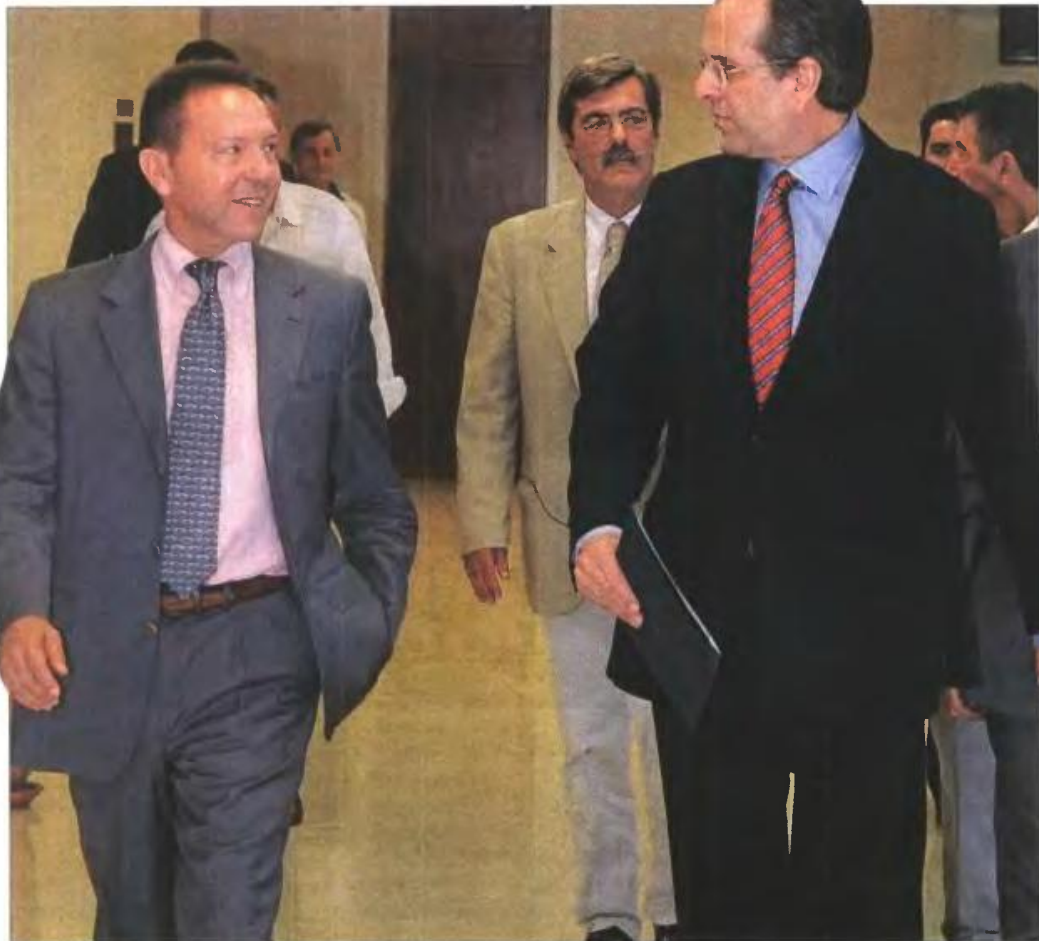
▲ Ο πρωθυπουργός Αντώνης Σαμαράς με τον υπουργό Οικονομικών Γιάννη Στουρνάρα λίγο πριν από τη χθεσινή συνάντηση για την εξειδίκευση των μέτρων

Όρισε ως «αντίπαλο» την ανεργία και είπε ότι η κυβέρνηση εξετάζει τα πάντα, αλλά δεν θα προ-