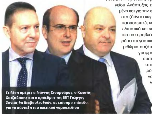
Σε δέκα ημέρες ο Γιάννης Στουρνάρας , ο Κώστας Κατσίδακας και ο προεδρός της ΕΕΤ Γιώργος Ζαγιός θα διαβουλευθούν, σε επίσημο επίπεδο, για τη συνταξη του σχετικού νομοσχεδίου

7) Για όλα τα παραπάνω δύναται η τράπεζα να εξαιρέσει όσους αποδείξουν ότι διαθέτουν ικανά περιουσιακά στοιχεία (καταθέσεις, επενδυτικά προϊόντα, εμβάσματα στο εξωτερικό, ακίνητη περιουσία κ.ά.).