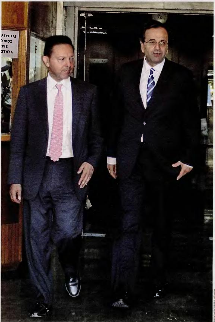
Ο κ. Γ. Στουρνάρας παρέδωσε χθες στον πρωθυπουργό το αρχικό πακέτο μέτρων, παρουσία και του υπουργού Εργασίας κ. Γ. Βρούτση. Η τελική μορφή των μέτρων αναμένεται να είναι έτοιμη στις αρχές Σεπτεμβρίου.

Πάντως, επιτελής του υπ. Οικονομικών κάνει λόγο για «μικροδομές διαφορετικά σενάρια». Ο ίδιος δήλωνε χθες ότι «τα νούμερα είναι αμείλιτα» χωρίς όμως να προδικάζει τις τελικές αποφάσεις. Επίσης, υψηλόβαθμο στέλεχος του υπουργείου δήλωνε χθες ότι «έχουμε βγάλει από τη μύγα ξηγκί». Διάσταση απόψεων υπάρχει και ως προς τον τελικό χρόνο οριστικοποίησης των μέτρων αλλά και ως προς τον περιεχόμενο του πακέτου. Μάλιστα ο πρωθυπουργός δεν έκρυψε τον σκεπτικισμό του για το αν ορισμένα μέτρα τύχουν της αποδοχής των άλλων πολιτικών αρχών και ζήτησε την επανεξέτασή τους.