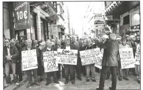
Οι συνταξιούχοι θα είναι πάλι από τα μεγαλύτερα θύματα της «δημοσιονομικής προσαρμογής» για λογαριασμό των μονοπωλίων