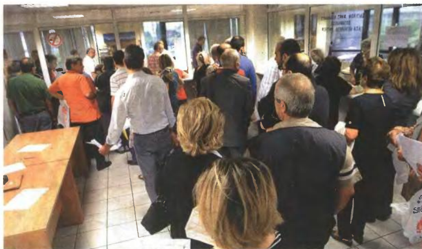
Σε πολλές περιπτώσεις οι φόροι είναι περισσότεροι από τα έσοδα των φορολογουμένων, που σπεύδουν στις εφορίες για διακανονισμό