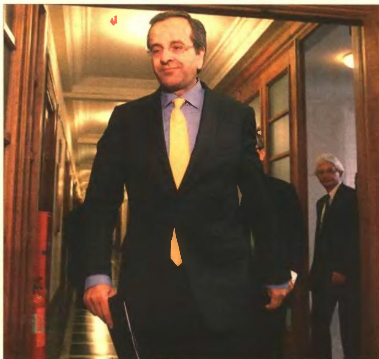
► Ο Αντ. Σαμαράς προσέρχεται στο Υπουργικό Συμβούλιο. Ο πρωθυπουργός χαρακτήρισε «ισχυρό» το λόγο της δραχμής εντός και εκτός Ελλάδος και επανέλαβε την απόφασή του να εργασθεί για την αποκατάσταση της αξιοπιστίας της χώρας.

Ωστόσο, τα αντίμετρα φαίνεται πως μπορούν να προκύψουν άμεσα μόνο μέσω της δόσης του δανείου καθώς κρίσιμη παράμετρος για την επανεκκίνηση της οικονομίας θεωρείται η αποπληρωμή των οφειλών του Δημοσίου, τουλάχιστον μερικές μέχρι το τέλος του χρόνου. Αντίμετρα στην ύφεση θεωρούνται επίσης η ολοκλήρωση της κατασκευής των αυτοκινητοδρόμων, η περαιτέρω απορρόφηση κονδυλίων από το ΕΣΠΑ αλλά και το νέο φορολογικό σύστημα στο οποίο η κυβέρνηση δίνει ιδιαίτερη έμφαση.