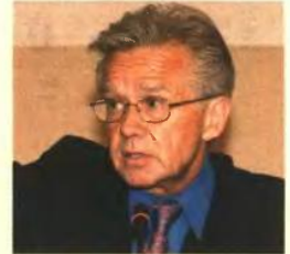
➤ Ο εκπρόσωπος του ΔΝΤ Τζέρι Ράις, τόνισε ότι για να προχωρήσει ένα Πρόγραμμα πρέπει να αποδεικνύεται πως το χρέος είναι βιώσιμο

Πηγές που γνωρίζουν την κατάσταση της οικονομίας, εκφράζουν ανυποχώρια για τις καθυστερήσεις στη