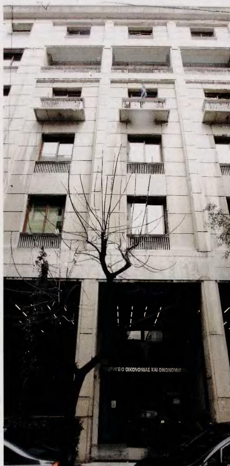
Με στόχο να εξασφαλιστεί 229 εκατ. ευρώ στη διετία 2013-2014, βρίσκεται στο μικροκόπιο του υπουργείου Οικονομικών όλες οι φοροαπαλλαγές που υπάρχουν.

α) τα επιβατικά αυτοκίνητα μέχρι 1.650 κ.εκ. που προορίζονται για ανάπηρους πολέμου, περιόδου δικτατορίας και Εθνικής Αντίστασης. Οι έχοντες 100% ποσοστό αναπηρίας δικαιούνται απαλλαγή για αυτοκίνητο μεγαλύτερου κυβισμού. Υπάρχει η δυνατότητα παραλαβής επιβατικού αυτοκινήτου μεγαλύτερου κυβισμού με την καταβολή ποσοστού του αναλο-