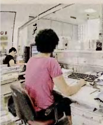
Στο στόχαστρο οι απαλλαγές των πολύτεκνων και των τρίτεκνων από τα τέλη ταξινόμησης οχημάτων.

Κατ' εξαίρεση της αρχής με την οποία η απαλλαγή από τον ΦΜΑ για απόκτηση πρώτης κατοικίας δίδεται μόνο σε ενήλικες, η απαλλαγή αυτή χορηγείται και σε ανήλικα παιδιά, εφόσον αυτά στερούνται και τους δύο γονείς τους και τελούν υπό επιτροπεία ή υπό την επίμελεια τρίτου προσώπου που έχει οριστεί με δικαστική απόφαση.