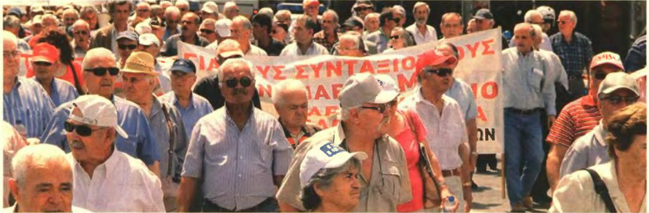
«ΞΑΝΑΓΡΑΦΟΝΤΑΙ» ΤΑ ΜΕΤΡΑ ΓΙΑ ΤΙΣ ΜΕΙΩΣΕΙΣ ΤΩΝ 5,5 ΔΙΣ. ΕΥΡΩ

στους εκπροσώπους του ΠΑΣΟΚ και της ΔΗΜ.ΑΡ., οι οποίοι αναζητούν τα ισοδύναμα που θα αμβλύνουν το κοινωνικό και πολιτικό κόστος των περικοπών.