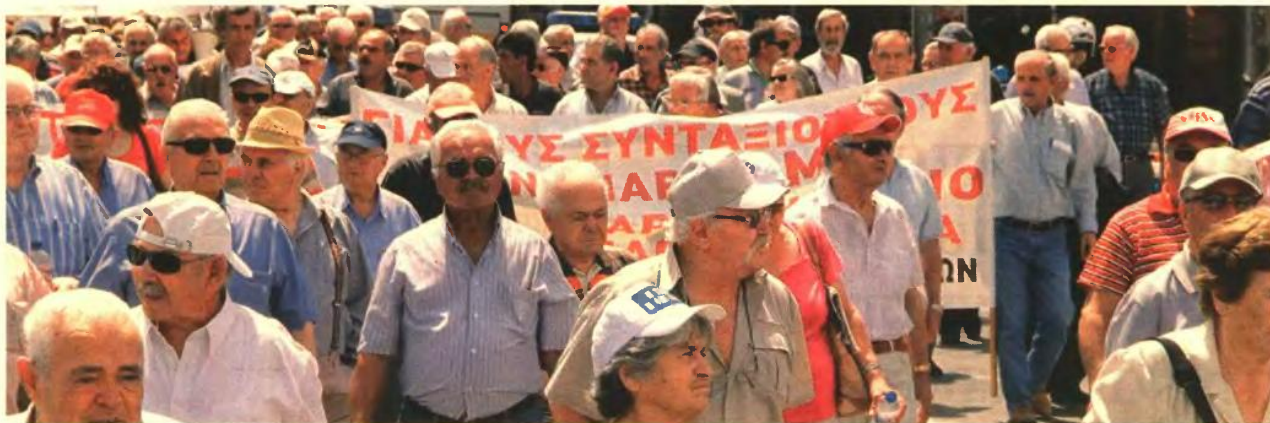
«ΞΑΝΑΓΡΑΦΟΝΤΑΙ» ΤΑ ΜΕΤΡΑ ΓΙΑ ΤΙΣ ΜΕΙΩΣΕΙΣ ΤΩΝ 5,5 ΔΙΣ. ΕΥΡΩ

στους εκπροσώπους του ΠΑΣΟΚ και της ΔΗΜ.ΑΡ., οι οποίοι αναζητούν τα ισοδύναμα που θα αμβλύνουν το κοινωνικό και πολιτικό κόστος των περικοπών.