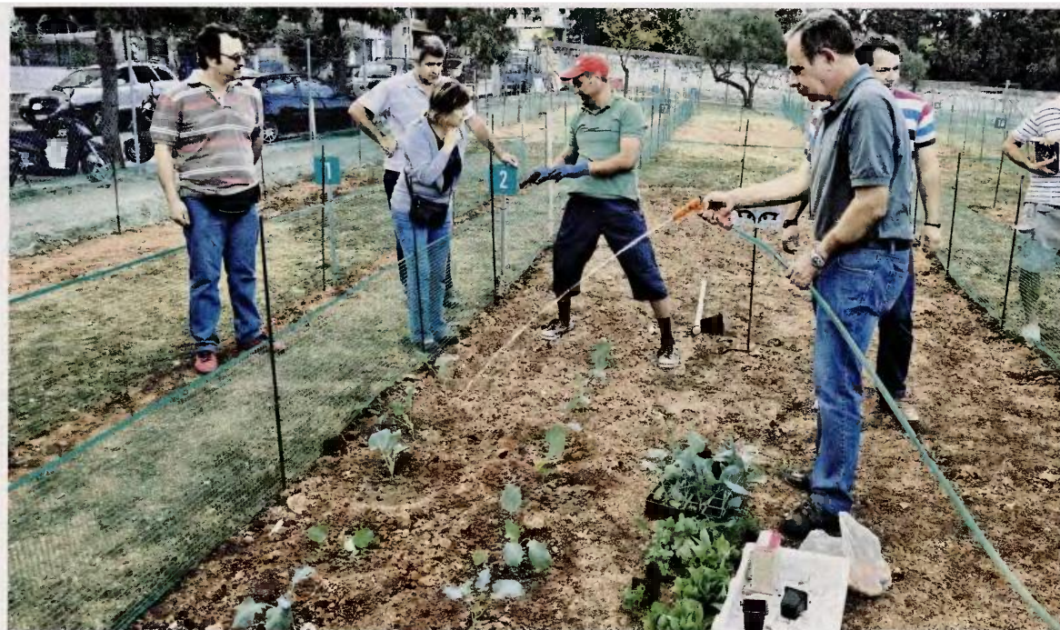
Τους πρώτους σπόρους (παροδοσιακές ποικιλίες μαρουλιού, λάχανου και ρόκας από τη βόρεια Εύβοια) διέθεσε η εναλλακτική κοινότητα «Πελίτι».