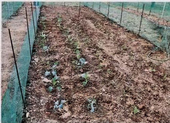
Οι λαχανόκηποι βρίσκονται στην περιοχή του Ασυρμάτου, κοντά στο αμαρζοστάσιο της ΕΘΕΛ και διανεμήθηκαν με κοινωνικά κριτήρια.

Τους πρώτους σπόρους (παροδοσιακές ποικιλίες μαρουλιού, λάχανου και ρόκας από τη βόρεια Εύβοια) διέθεσε η εναλλακτική κοινότητα «Πελίτι», που διατηρεί μία από τις πιο πλούσιες τράπεζες σπόρων στην Ελλάδα. Παρών εκ μέρους της, ο κ. Άκης Αντωνιάδης ενημέρωσε για τις δράσεις της, ενώ από το τραπέζι με τα φυλλάδια της ανάρπαστοι έγιναν οι σπόροι που διέθεσε και στους υπόλοιπους επισκέπτες. Το νερό για την άρδευση θα προέρχεται αρχικά από γεωτρήση, ενώ μελλοντικά από το δίκτυο της ΕΥΔΑΠ.