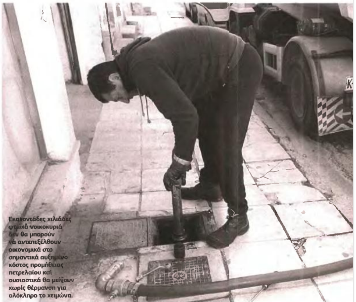
Εκατοντάδες χιλιάδες φτωγά νοικοκυριά δεν θα μπορούν να αντεπεξέλθουν οικονομικά στο σημαντικά αυξημένο κόστος προμήθειας πετρελαίου και ουσιαστικά θα μείνουν χωρίς θέρμανση για ολόκληρο το χειμώνα.

4 Γεωγραφικά Κλιμακώση επιδόματος ανάλογα με τη γεωγραφική ζώνη διαμονής: Το επίδομα κλιμακώνεται με κριτήριο τον τόπο διαμονής του δικαιούχου.