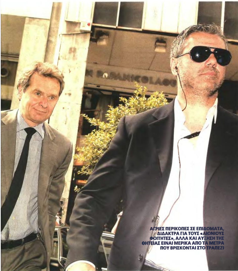
ΑΓΡΙΕΣ ΠΕΡΙΚΟΠΕΣ ΣΕ ΕΠΙΔΟΜΑΤΑ, ΔΙΔΑΚΤΡΑ ΓΙΑ ΤΟΥΣ «ΛΙΘΝΙΟΥΣ ΦΟΙΤΗΤΕΣ», ΑΛΛΑ ΚΑΙ ΑΥΞΗΣΗ ΤΗΣ ΘΥΓΕΙΑΣ ΕΙΝΑΙ ΜΕΡΙΚΑ ΑΠΟ ΤΑ ΜΕΤΡΑ ΠΟΥ ΒΡΙΣΚΟΝΤΑΙ ΣΤΟ ΤΡΑΠΕΖΙ

άχρηστα τα μέτρα και προειδοποιούν: «Η κόβετε τις δαπάνες των υπουργείων ή μειώνετε και πάλι τις αποδοχές»