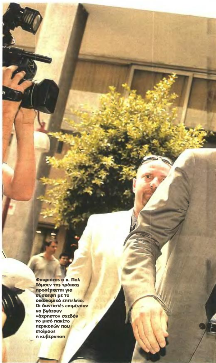
Φουριόζος ο κ. Πολ Τόμσεν της τρόικας προσέρχεται για σύσκεψη με το οικονομικό επιτελείο. Οι δανειστές επιμένουν να βγάζουν «άχρηστο» σχεδόν το μισό πακέτο περικοπών που ετοίμασε η κυβέρνηση

Οι δανειστές θεωρούν από υπεισθεδόμενες μέχρι και ανεδραφικές τις εκτιμήσεις των υπουργείων για εξοικονόμηση 11,5 δισ. ευρώ με τα μέτρα που προτείνουν, ακόμα και εάν εφαρμοστούν όλα μαζί αθροιστικά και όχι εναλλακτικά, ως δημοσιονομικά ισοδύναμα, γι' αυτό και έχουν ζητήσει να γίνει νέα επεξεργασία των στοιχείων των σχεδόν 50 μέτρων που εξετάζαν μέχρι τώρα τα υπουργεία.