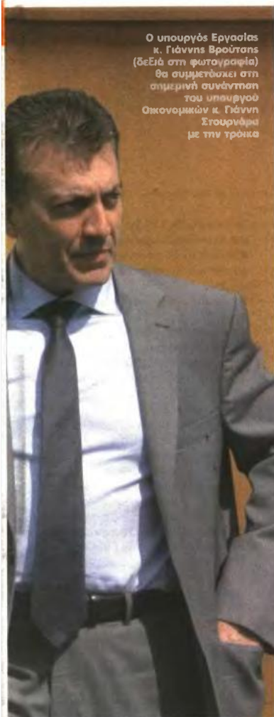
Ο υπουργός Εργασίας κ. Γιάννης Βρούτσης (δεξιά στη φωτογραφία) θα συμμετάσχει στη σημερινή συνάντηση του υπουργού Οικονομικών κ. Γιάννη Στουρνάρα με την τρόικα

μάτων και μικρομεσαίων εταιρειών. Ολοκληρώνονται οι συζητήσεις με τις τράπεζες