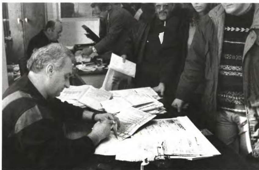
Το οικονομικό επιτελείο σχεδιάζει να καταργήσει από τα εισοδήματα του 2012 όλες τις εκπτώσεις από το φόρο εισοδήματος ποσοστού 10% των δαπανών για τόκους στεγαστικών δανείων πρώτης κατοικίας, ιατρικές επισκεψεις και εξετάσεις, νοσήλια.

► Κατάργηση των εκπτώσεων φόρου 10% δαπανών για τόκους στεγαστικών δανείων πρώτης κατοικίας, ενδοκίβια κυρίως κατοικίας και παιδιών που σπουδάζουν, διδάκτρα φροντιστηρίων και ιδιαίτερα μαθήματα, ιατρικές επισκεψεις και εξετάσεις, νο-