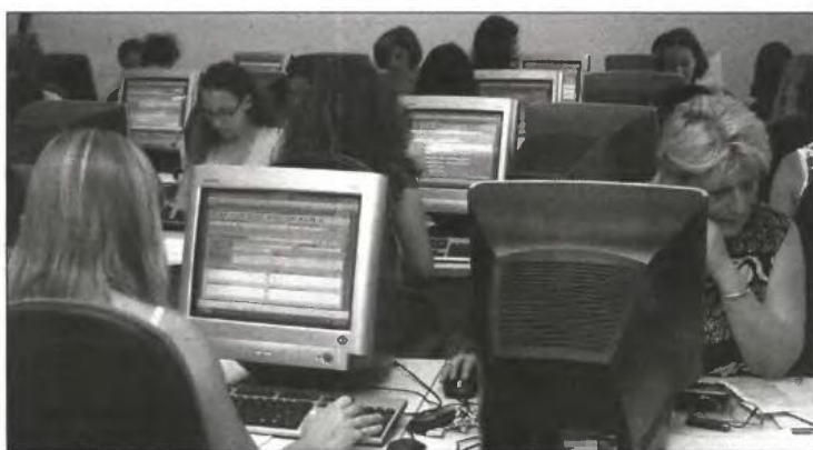
Καταργούνται τα εποχικά επίδομα για εργαζόμενους σε κλάδους με εποχικά κριτήρια απασχόλησης (κατασκευές, τουρισμός, εκπαίδευση)

Μ ια σειρά ρυθμίσεων για τον εξορθολογισμό των επιδομάτων περιλαμβάνεται στα μέτρα που έχει συμφωνήσει η τράπεζα με την κυβέρνηση. Ειδικότερα προβλέπονται: - Θέσπιση της νομοθεσίας για τη μείωση επιδομάτων για τα ανασφάλιστα άτομα ανάλογα με το αν ο δικαιούχος ενοικιάζει ή όχι τον τόπο κατοικίας του (περιοχή 50 ευρώ για τους ιδιοκτήτες και 30 ευρώ για τους μη ιδιοκτήτες), με στόχο την εξοικονόμηση 13 εκατ. ευρώ το 2013 και επιπλέον 13 εκατ. ευρώ το 2014 - Θέσπιση νομοθεσίας για την αντικατάσταση των οικογενειακών επιδομάτων με ένα συγκεκριμένο επίδομα για τη μείωση των δαπανών κατά 86 εκατ. ευρώ το 2013. - Κατάργηση των εποχικών επιδομάτων για εργαζόμενους σε κλάδους με εποχικά κριτήρια απασχόλησης (κατασκευές, τουρισμός, εκπαίδευση), με στόχο την επίσημη εξοικονόμηση 70 εκατ. ευρώ το 2013. - Θέσπιση νομοθεσίας για την κατάργηση των ειδικών επιδομάτων σε