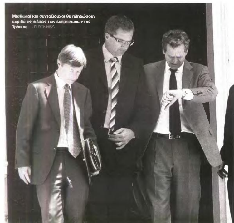
Μισθωτοί και συνταξιούχοι θα πληρώσουν ακριβά τις πιέσεις των εκπροσώπων της Τρόικας. > ΕΥΡΩΚΡΙΣΙΣ

Το οικονομικό επιτελείο θα λάβει τις τελικές αποφάσεις μετά τη συνάντηση με την Τρόικα στις αρχές Σεπτεμβρίου.