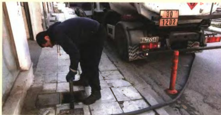
Παρά τις υποσχέσεις ότι η εξίσωση του ΕΦΚ του πετρελαίου κίνησης με το πετρέλαιο θέρμανσης θα γίνει μετά την μείωση του ΕΦΚ του κίνησης στο 80% της ισχύουσας, η αύξηση στο λίτρο για το θέρμανσης θα φτάσει το 35%

Το πρώτο από αυτά τα μέτρα, θα ανακοινωθεί επίσημα μέχρι και τις 15 Οκτωβρίου. Αφορά την τιμή του πε-