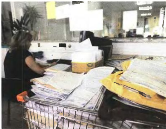
Το νέο σύστημα υπολογισμού φόρου, που αυξάνει έξιμеса το αφορολόγητο όριο των μισθωτών και των συνταξιούχων από τις 5.000 στις 9.000 ευρώ, εξετάζεται να τεθεί σε ισχύ από τα εισοδήματα του 2013.

Θα προβλέπει τρία μόνο φορολογικά κλιμάκια, με συντελεστές φόρου 21%, 36% και 45%