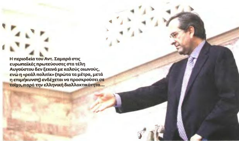
Η περιодεία του Αντ. Σαμαρά στις ευρωπαϊκές πρωτεύουσες στα τέλη Αυγούστου δεν ξεκινά με καλούς καιρούς, ενώ η «ρεάλ πολιτική» (πρώτα τα μέτρα, μετά η επιμήκυνση) ενδέχεται να προσκρούσει σε τοίχο, παρά την ελληνική διαλλακτικότητα...

Άλλοι όμως στην κυβέρνηση επιμένουν ότι αυτή η προσέγγιση θα ήταν σωστή, αν η χώρα βρισκόταν στην αρχή της εφαρμογής του προγράμ-