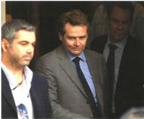
► Τα «προαπαιτούμενα» της τρόικας

Σύμφωνα με πληροφορίες, η τρόικα, για να έρθει η δόση, θα ζητήσει μια σειρά από «προαπαιτούμενες δράσεις», όπως, άλλωστε, συνέβη και τον Μάρτιο. Προς το παρόν, σύμφωνα με κυβερνητικά στελέχη, η τρόικα μιλά λίγο γ' αυτές, πιο πολύ ακούει. Λίγο μιλά και για