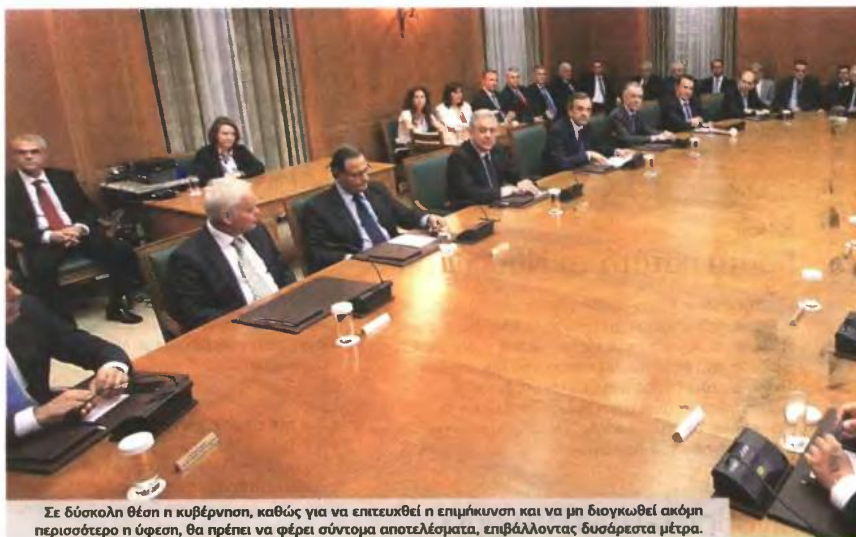
Σε δύσκολη θέση η κυβέρνηση, καθώς για να επιτευχθεί η επιμήκυνση και να μη διογκωθεί ακόμη περισσότερο ο ύψους, θα πρέπει να φέρει σύντομα αποτελέσματα, επιβάλλοντας δυσάρεστα μέτρα.

Μείωση 10% στις κύριες συντάξεις που υπερβαίνουν τα 1.500 ευρώ (εξοικονόμηση 600 εκατ.), πλαφόν 2.400 ευρώ στο σύνολο κύριων και επικουρικών