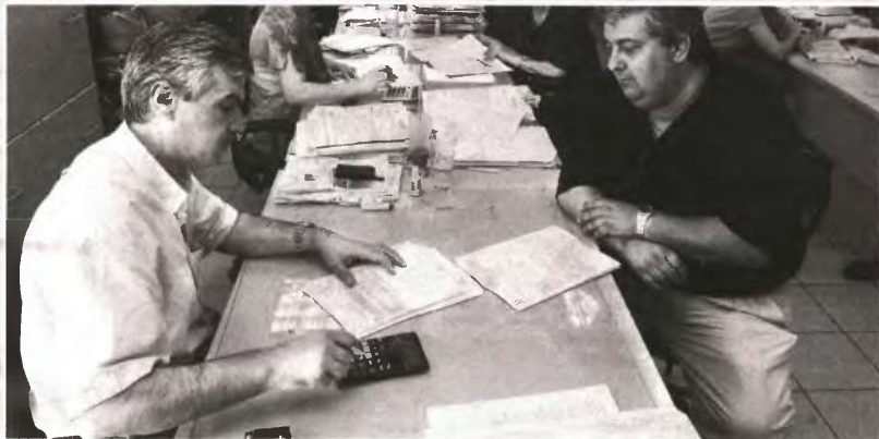
▲ ΠΡΟΘΕΣΗ της κυβέρνησης να προχωρήσει σε αλλαγές στη φορολογία των επιχειρήσεων