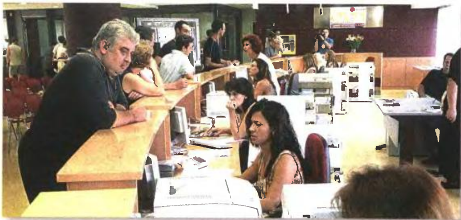
Διαγραφή σημαντικού μέρους προστιμών και προσαυξήσεων προβλέπει η νέα ρύθμιση