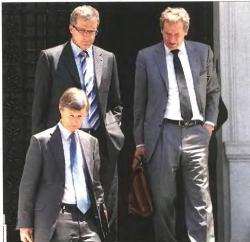
▲ Ματίας Μορς, Κλάους Μαζούχ και Πολ Τόμσεν έξω από το Μέγαρο Μαξίμου

Το μοντέλο που πρόκειται να ακολουθηθεί στο πλαίσιο των περικοπών στα κοινωνικά επιδόματα είναι αυτό της εφαρμογής αυστηρών εισοδηματικών - περιουσιακών κριτηρίων. Αυτό σημαίνει ότι, αν κάποιος έχει εισόδημα από κάποια άλλη πηγή (π.χ. ακίνητο από κληρονομιά), θα βρίσκεται υπό την απειλή είτε της περικο-