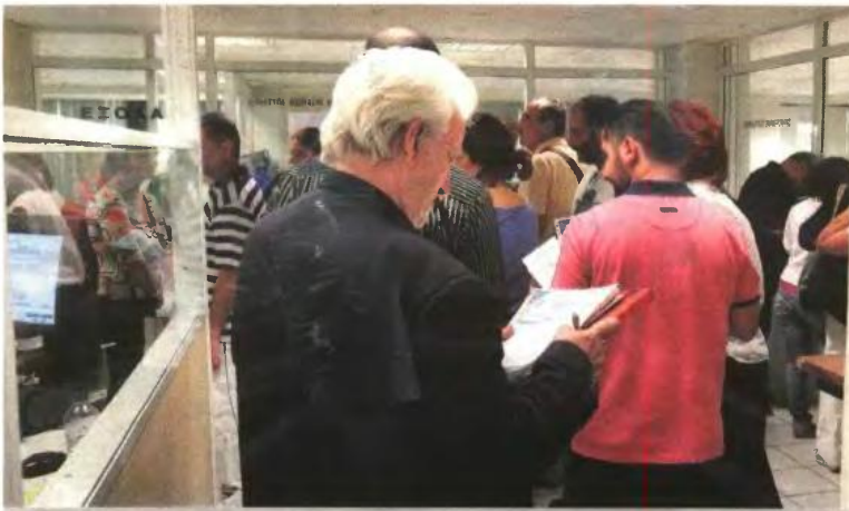
Για ευπαθείς κοινωνικές και ασθενείς οικονομικά ομάδες ορισμένες φοροαπαλλαγές θα διατηρηθούν. Για τους υπολοίπους, θα περικοπούν ανάλογα με το ύψος του ατομικού εισοδήματος.

ΓΙΩΡΓΟΣ ΠΑΛΑΙΤΣΑΚΗΣ gpalitsakis@e-typos.com