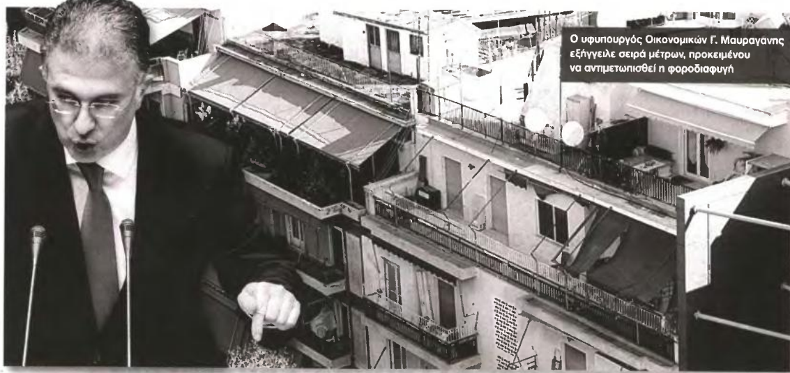
Ο υφυπουργός Οικονομικών Γ. Μαυραγάνης εξήγγειλε σειρά μέτρων, προκειμένου να αντιμετωπισθεί η φοροδιαφυγή