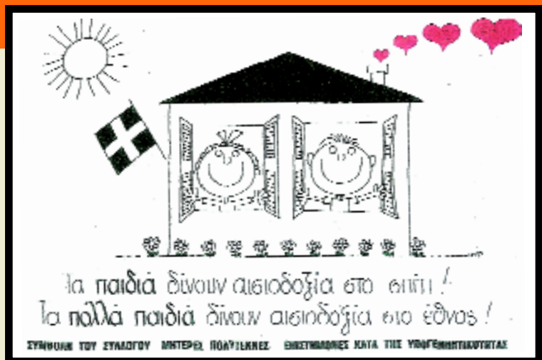
Σκίτσο του «ΚΥΡ»