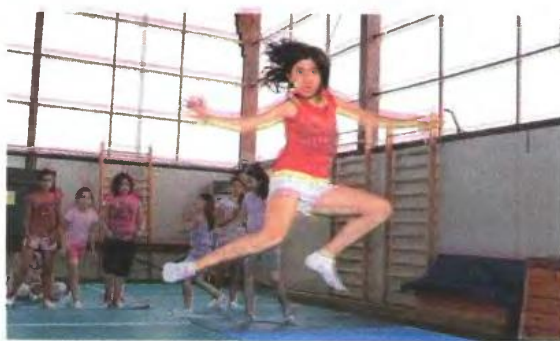
▲ ΤΑ ΠΡΟΓΡΑΜΜΑΤΑ δημιουργικής απασχόλησης δίνουν τη δυνατότητα στα παιδιά να απασχοληθούν, να αθληθούν και να διασκεδάσουν

Επιπλέον το δεκατιανό (χυμός+τοστ) το προσφέρει ο δήμος. Στους περισσότερους δήμους η δημιουργική απασχόληση είναι δωρεάν, ενώ σε κάποιους άλλους οι γονείς πληρώνουν συνδρομή που στις περισσότερες περιπτώσεις είναι συμβολική.