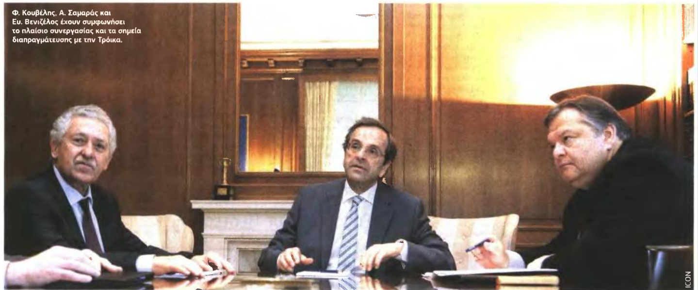
Φ. Κουβέλης, Α. Σαμαράς και Ευ. Βενιζέλος έχουν συμφωνήσει το πλαίσιο συνεργασίας και τα σημεία διαπραγμάτευσης με την Τρόικα.

σμεύονται ότι θα εφαρμοστούν τα ακόλουθα μέτρα: