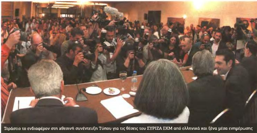
Τεράστιο το ενδιαφέρον στη χθεσινή συνέντευξη Τύπου για τις θέσεις του ΣΥΡΙΖΑ ΕΚΜ από ελληνικά και ξένα μέσα ενημέρωσης