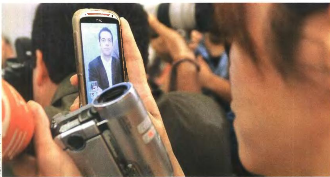
Βιντεοσκόπηση της ομιλίας Τσίπρα, χθες στην παρουσίαση του οικονομικού προγράμματος του ΣΥΡΙΖΑ. Για να έχουμε να θυμόμαστε...