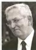
ΕΥΑΓΓΕΛΟΣ ΛΙΒΙΕΡΑΤΟΣ ΥΠ. ΠΕΡΙΒΑΛΛΟΝΤΟΣ

ΑΠΟ το 1979 είναι καθηγητής της Ανωτέρας Γεωδαισίας και Χαρτογραφίας στην Πολυτεχνική Σχολή του Πανεπιστημίου Θεσσαλονίκης. Σπούδασε τοπογράφος μηχανικός στο ΕΜΠ, απ' όπου πήρε και διδακτορικό το 1974. Το 1976 ανακηρύχθηκε δίδακτωρ Φιλοσοφίας της Πανεπιστημίου της Ουψάλα, ενώ σήμερα είναι πρόεδρος της Επιτροπής της Διεθνούς Χαρτογραφικής Ένωσης (ICA) για τις ψηφιακές τεχνολογίες στη χαρτογραφική κληρονομιά.