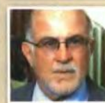
ΓΙΩΡΓΟΣ ΒΕΡΝΙΚΟΣ Υφυπουργός στο υπουργείο Ναυτιλίας και Αιγαίου που επανασυστάθηκε