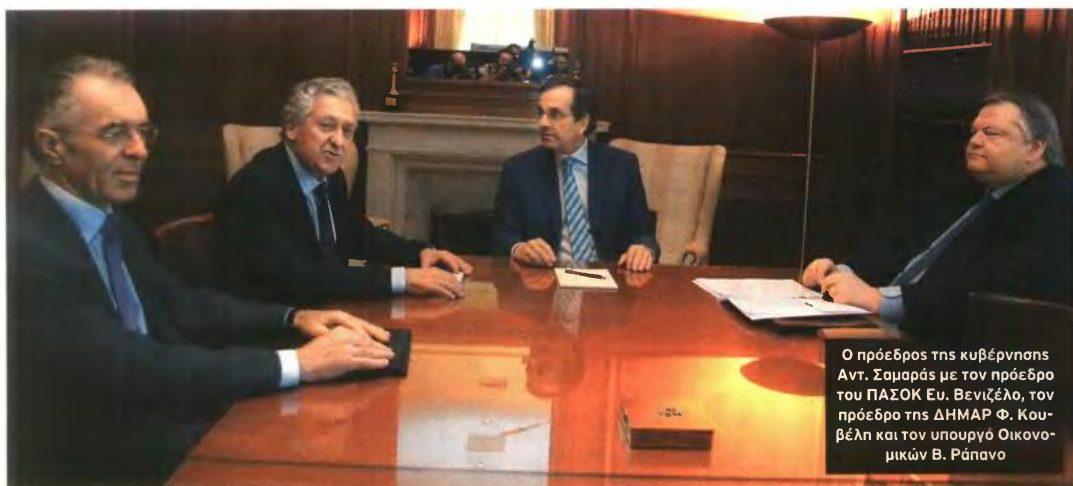
Ο πρόεδρος της κυβέρνησης Αντ. Σαμαράς με τον πρόεδρο του ΠΑΣΟΚ Ευ. Βενιζέλο, τον πρόεδρο της ΔΗΜΑΡ Φ. Κουβέλη και τον υπουργό Οικονομικών Β. Ράπανο