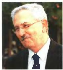
► Ο ΥΠΟΥΡΓΟΣ ΠΕΚΑ Ευ. Λιβιεράτος