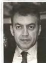
ΓΙΑΝΝΗΣ ΒΡΟΥΤΣΗΣ ΥΠ. ΕΡΓΑΣΙΑΣ

ΑΠΟ το 1979 είναι καθηγητής της Ανωτέρας Γεωδαισίας και Χαρτογραφίας στην Πολυτεχνική Σχολή του Πανεπιστημίου Θεσσαλονίκης. Σπούδασε τοπογράφος μηχανικός στο ΕΜΠ, απ' όπου πήρε και διδακτορικό το 1974. Το 1976 ανακηρύχθηκε δίδακτωρ Φιλοσοφίας της Πανεπιστημίου της Ουψάλα, ενώ σήμερα είναι πρόεδρος της Επιτροπής της Διεθνούς Χαρτογραφικής Ένωσης (ICA) για τις ψηφιακές τεχνολογίες στη χαρτογραφική κληρονομιά.