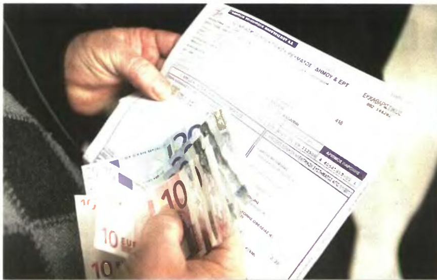
Έρχεται και η πρώτη δόση από το περιφημο χαράτσι για τα ακίνητα, το οποίο θα πληρωθεί σε πέντε διμηνιαίες δόσεις

Η αρχή γίνεται με το φόρο εισοδήματος, ο οποίος είναι αυξημένος σε σχέση με πέρυσι κατά 58%-300%. Να! Είναι τόση η φορομανία που ζητεί πάνω από 3.000 ευρώ σε τρίτεκνους και πολύτεκνους. Από άστεγο που τρέφεται σε συσσίτια ζητάει 250 ευρώ και από άνεργο ο οποίος έχει ένα παλιό Ι.Χ. των 1.200 κ.ε. και ένα σπίτι στο Πέραμα της ανεργίας 400 ευρώ φόρο! Και τον κοροϊδεύει από πάνω το κράτος, αφού του λέει «μπορείς να πας στον έφορο να σου κάνει ρύθμιση!»... Όμως τον φόρο εισοδήματος