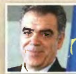
ΔΗΜΗΤΡΗΣ ΚΟΥΚΟΥΡΟΥΛΑΣ Τοποθετήθηκε υφυπουργός Εξωτερικών