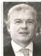
ΑΝΔΡΕΑΣ ΛΥΚΟΥΡΠΕΝΤΖΟΣ ΥΠ. ΥΓΕΙΑΣ

ΓΕΝΝΗΘΗΚΕ στην Αθήνα και κατάγεται από τις Κυκλάδες. Οικονομολόγος, εξελέγη για πρώτη φορά βουλευτής Κυκλάδων το 2007, επανεξελέγη το 2009 και στις πρόσφατες εκλογές. Εργάστηκε στο υπουργείο Οικονομικών, ενώ είχε έντονη δράση στην τοπική αυτοδιοίκηση, αλλά και στη ΝΔ ως μέλος του Εκτελεστικού Γραφείου του κόμματος.