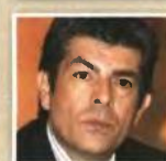
ΘΕΟΔΩΡΟΣ ΠΑΠΑ-ΘΕΟΔΩΡΟΥ Υφυπουργός Παιδείας. Προτάθηκε από τη ΔΗΜΑΡ για το νέο υπουργείο