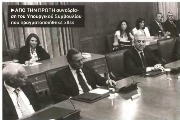
▶ ΑΠΟ ΤΗΝ ΠΡΩΤΗ συνεδρίαση του Υπουργικού Συμβουλίου που πραγματοποιήθηκε χθες

Το υπουργείο Οικονομικών με επικεφαλής τον Β. Ράπανο έχει αναπληρωτή υπουργό και υφυπουργό από τη ΝΔ, ενώ, όπως ήταν φυσικό, ο υπουργός Επικρατείας και ο κυβερνητικός εκπρόσωπος είναι συνεργάτες του Α. Σαμαρά. Η πρόταση της ΝΔ για πρόεδρο της Βουλής είναι ο Ευ. Μείμαρakis, ενώ αναμφίβολα κεντρικό πρόσωπο της κυβέρνησης είναι ο νέος «τσάρος» της Οικονομίας και διαπρεπής οικονομολόγος Β. Ράπανος.