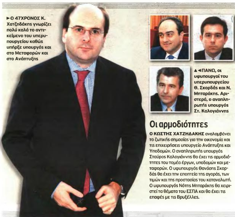
► Ο 47ΧΡΟΝΟΣ Κ. Χατζηδάκης γνωρίζει πολύ καλά το αντικείμενο του υπερυπουργείου καθώς υπήρξε υπουργός και στο Μεταφορών και στο Ανάπτυξης

Ο κ. Χατζηδάκης, 47 χρόνων, γνωρίζει πολύ καλά τα δύο υπου-