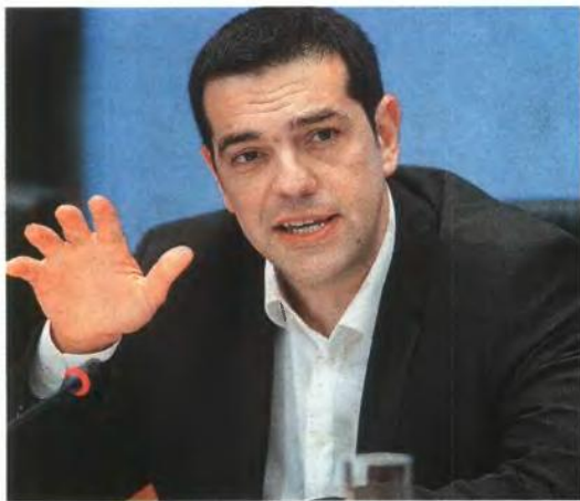
▲ «ΘΑ ΣΤΑΘΟΥΜΕ ΣΥΝΕΠΙΣΤΕΙ στις προεκλογικές μας δεσμεύσεις για έξοδο της χώρας από τα καταστροφικά Μνημόνια», το μήνυμά της ηγεσία του ΣΥΡΙΖΑ

Στην Κουμουνδούρου υπογραμμίζουν ακόμη ότι η νέα κυβέρνηση στηρίζεται κατά κύριο λόγο από τις