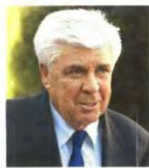
«Ο ΥΠΟΥΡΓΟΣ Αγροτικής Ανάπτυξης Αθ. Τσαυτάρης