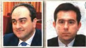
▲ «ΠΑΝΩ, οι υφυπουργοί του υπερυπουργείου Θ. Σκορδάς και Ν. Μητράκης. Αριστερά, ο αναπληρωτής υπουργός Στ. Καλογιάννης