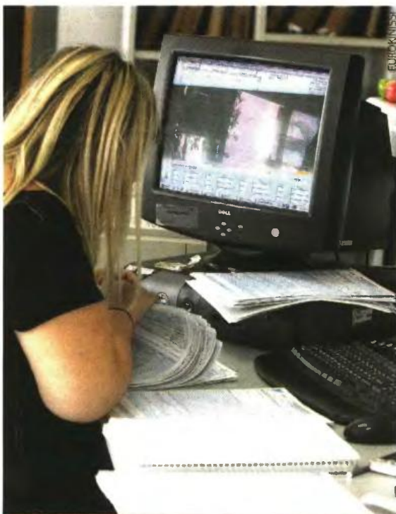
Υπερφορολόγηση για 4,2 εκατ. φορολογούμενους με μηδενικά, χαμηλά και μεσαία εισοδήματα.

Επιβάρυνση 116,25 € για κάθε φορολογούμενο που δεν είχε εισοδήματα κατά τη διάρκεια του 2011