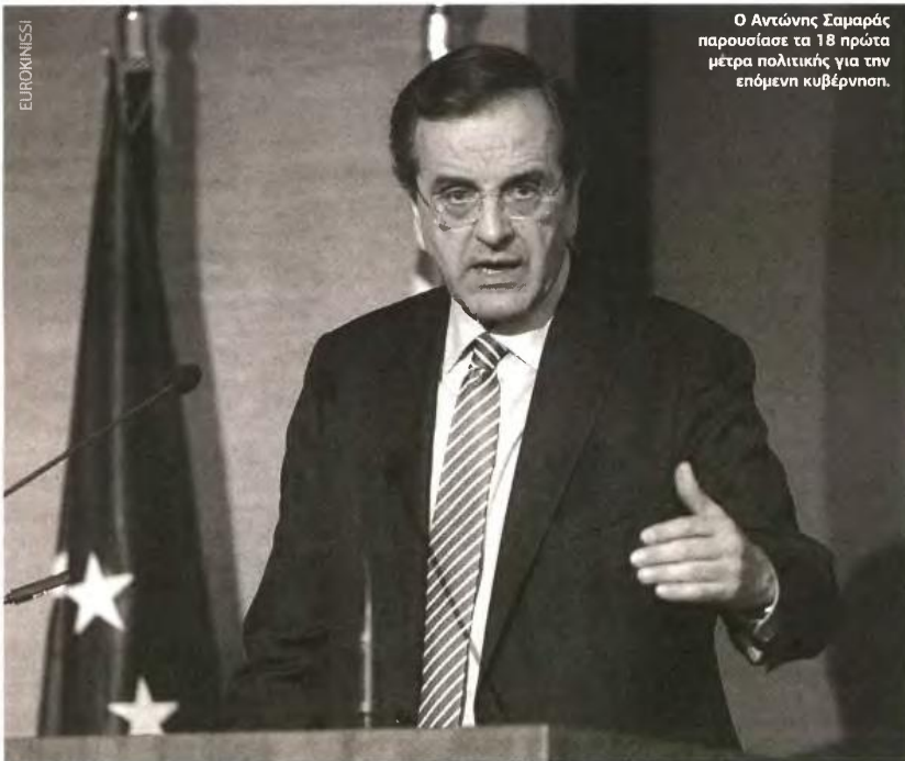
Ο Αντώνης Σαμαράς παρουσίασε τα 18 πρώτα μέτρα πολιτικής για την επόμενη κυβέρνηση.

Ξεκαθαρίζοντας πως κύριος άξονας της πολιτικής του είναι η δημιουργία νέων θέσεων εργασίας, ο κ. Σαμαράς τόνισε πως, με τα εργαλεία που ήδη διαθέτει σήμερα η χώρα, τα 12,5 δισ. ευρώ από το ΕΣΠΑ στα επόμενα τρία χρόνια, τη ρευστότητα για την οικονομία μετά την επανακεφαλαιοποίηση των τραπεζών και