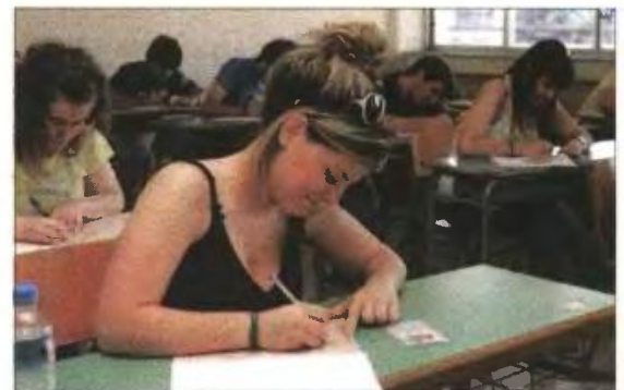
▲ Μαθήτρια διαγωνίζεται στις πανελλαδικές

Για τον λόγο αυτό φέτος αναμένεται να πάει πίσω, περίπου στα τέλη Ιουλίου, η κατάσταση των μηχανογραφικών δελτίων. Όσοι υποψήφιοι δεν έχουν ήδη αποκτήσει τον κωδικό ασφαλείας, που είναι απαραίτητος για τη συμπλήρωση του μηχανογραφικού τους, θα πρέπει να σπεύσουν από τις 6 έως τις 22 Ιουνίου να τον παραλά-