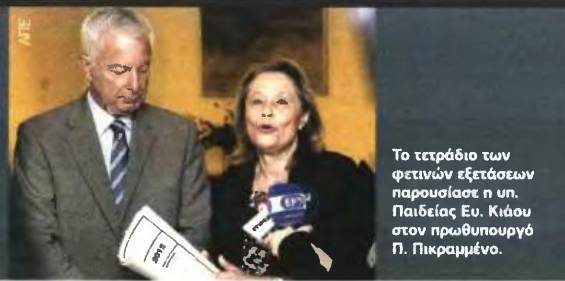
Το τετράδιο των φετινών εξετάσεων παρουσίασε η υπ. Παιδείας Ευ. Κιάου στον πρωθυπουργό Π. Πικραμμένο.

ΧΩΡΙΣ ΕΛΛΕΙΨΕΙΣ ΑΡΧΙΣΑΝ ΣΗΜΕΡΑ ΟΙ ΕΞΕΤΑΣΕΙΣ ΜΕ ΤΟ ΜΑΘΗΜΑ ΤΗΣ ΝΕΟΕΛΛΗΝΙΚΗΣ ΓΛΩΣΣΑΣ