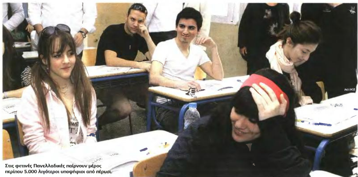
Στις φετινές Πανελλαδικές παίρνουν μέρος περίπου 5.000 λιγότεροι υποψήφιοι από πέρυσι.