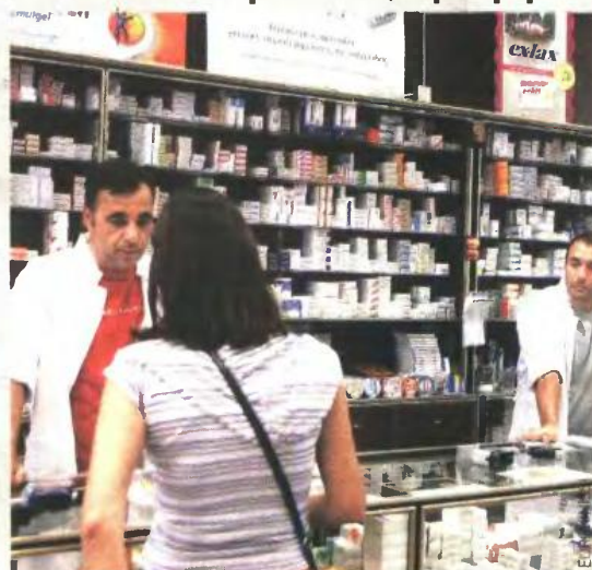
Οι φαρμακευτικές δαπάνες μπορούν να χρησιμοποιηθούν για την κάλυψη του αφορολόγητου.

ΟΙ ΦΑΡΜΑΚΕΥΤΙΚΕΣ δαπάνες, οι δαπάνες για την αγορά ορθοπαιδικών ειδών (νάρθηκες, κηδεμόνες, υποδήματα κ.λπ.), αναλωσίμων νοσηλευτικών υλικών, αναπηρικών βοηθητικών οργάνων (πατερίτσες, αναπηρικά αμαξίδια, στρώματα κατάκλισης κ.λπ.), ειδικών μηχανημάτων (νεφρολοπιπές, συσκευές αναρρόφησης, φιάλες οξυγόνου κ.λπ.), οι δαπάνες για έξοδα μετακίνησης και διαμονής των ασφαλισμένων, οι δαπάνες για βρεφονηπιακούς σταθμούς κ.λπ., που δεν καλύπτονται στο σύνολό τους από ασφαλιστικά ταμεία και ασφαλιστικές εταιρίες, μπορούν να χρησιμοποιηθούν από τους φορολογούμενους, μαζί με τις λοιπές δαπάνες, για την κάλυψη του αφορολόγητου ποσού, υπό την προϋπόθεση ότι δεν αποτελούν δαπάνες που εκπίπτουν με βάση άλλη φορολογική διάταξη. Για να είναι δυνατή η χρησιμοποίηση των δαπανών αυτών, στη βεβαίωση ιατρικής και νοσοκομειακής περίθαλψης που ήδη κορηνγείται από τους ασφαλιστικούς φορείς πρέπει να συμπεριλαμβάνεται ξεχωριστή κατηγορία με το ποσό των λοιπών δαπανών που προαναφέρθηκαν και το οποίο δεν κάλυψαν οι ασφαλιστικοί φορείς. Στη βεβαίωση πρέπει να αναγράφονται, σε χωριστή ένδειξη, το συνολικό ποσό της δαπάνης για το οποίο υποβλήθηκαν δικαιολογητικά, το ποσό της δαπάνης που καλύφθηκε από τον ασφαλιστικό φορέα, καθώς και το συνολικό υπόλοιπο ποσό της δαπάνης με το οποίο επιβαρύνεται ο ίδιος ο φορολογούμενος.