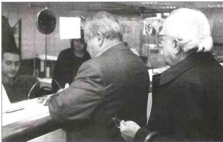
Με τη σύνταξη του Ιουνίου, στις 22 Μαΐου, θα καταβληθεί το ΕΚΑΣ του 2012

• στα προνοιακά βοηθήματα του υπουργείου Υγείας και Κοινωνικής Αλληλεγγύης. Στο κριτήριο αυτό συνοπολογίζονται το επίδομα