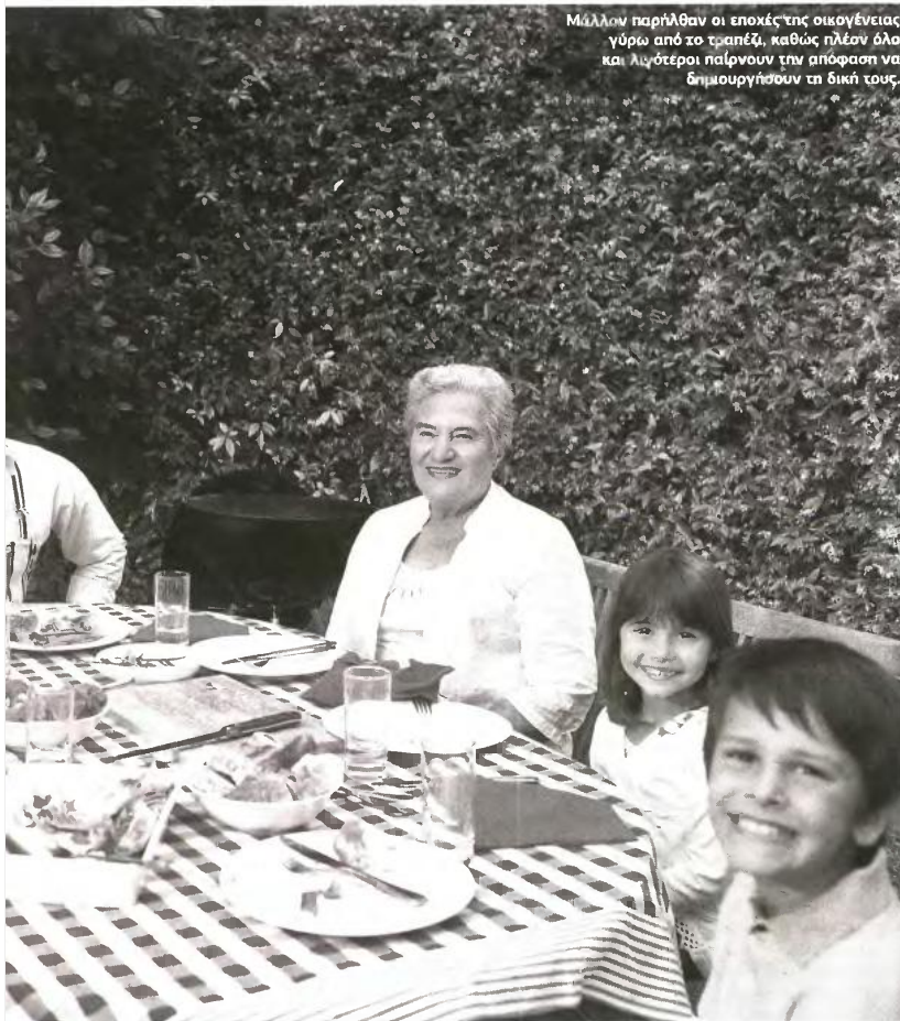
Μάλλον παρήλθαν οι εποχές της οικογένειας γύρω από το τραπέζι, καθώς πλέον όλο και λιγότεροι παίρνουν την απόφαση να δημιουργήσουν τη δική τους.