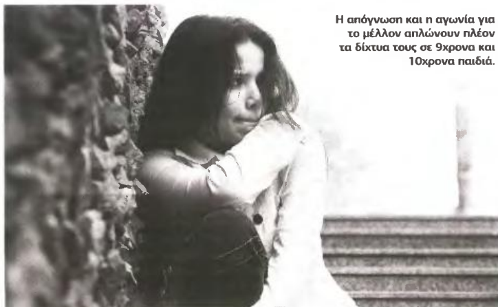
Η απόγνωση και η αγωνία για το μέλλον απλώνουν πλέον τα δίκτυα τους σε 9χρονα και 10χρονα παιδιά.

Κάμψη εμφανίζεται επίσης και στον αριθμό των ζευγαριών που αποφασίζουν να ανέβουν τα σκαλιά της εκκλησίας. Σύμφωνα με στατιστικά στοιχεία της Αρχιεπισκοπής Αθηνών, ο αριθμός των θρησκευτικών γάμων μειώθηκε κατά 727 το 2011, ενώ το 2010 τελέστηκαν 8.133 μυστήρια στην πρωτεύουσα. Την ίδια χρονική περίοδο, στη Θεσσαλονίκη 1.232 ζευγάρια χόρεψαν το χορό του Ησαΐα. Η μείωση του αριθμού των θρησκευτικών γάμων φαίνεται ότι οφείλεται κατά βάση στα... μέτρα λιτότητας. Ο στολισμός