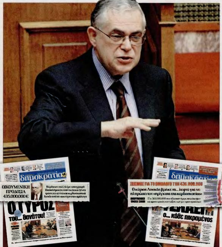
▲ Ο τέως πρωθυπουργός Λουκάς Παπαδήμος με τηλεφωνικό «γύρο» ενημέρωσε όλους τους πολιτικούς αρχηγούς για το «ακούρευτο» ομόλογο λέγοντάς τους όμως ότι «αν δεν πληρωθεί η Ελλάδα θα οδηγηθεί σε άτακτη χρεοκοπία». Ενθετα τα πρωτοσέλιδα της «δημοκρατίας» της περασμένης Τετάρτης και Πέμπτης

Οι κερδοσκόποι πληρώθηκαν με προκλητική ευκολία, μολοντί υπήρχαν εισηγήσεις τόσο από την Ευρώπη όσο και από την Ελλάδα να μη λάβουν ούτε ευρώ. Ούτως ή άλλως τόσο η τρέχουσα όσο και η προηγούμενη κυβέρνηση τους είχαν προειδοποιήσει ότι αν δεν συμμετείχαν στο «κούρεμα» του 75% θα έμεναν με τα ομό-