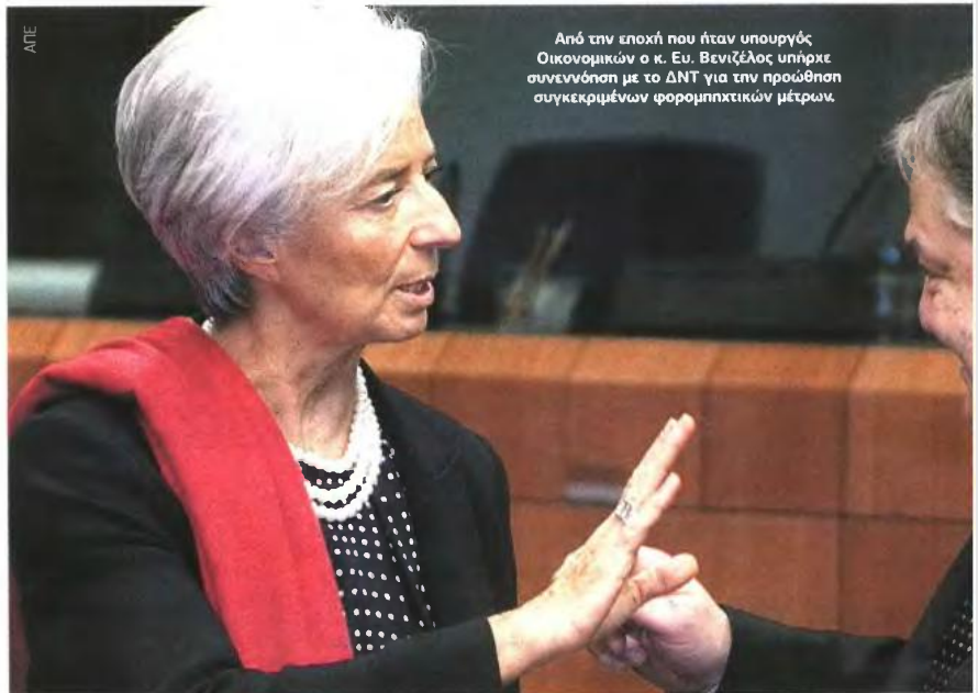
Από την εποχή που ήταν υπουργός Οικονομικών ο κ. Ευ. Βενιζέλος υπήρξε συνεννόηση με το ΔΝΤ για την προώθηση συγκεκριμένων φορομνημονιακών μέτρων.

Ν έο επαχθέστερο φορολογικό σύστημα, που προβλέπει λιγότερα φορολογικά κλιμάκια για τον υπολογισμό του φόρου εισοδήματος των φυσικών προσώπων, κατάργηση όλων των απαλλαγών και των εκπτώσεων από τη φορολογία εισοδήματος, εφαρμογή αντικειμενικών κριτηρίων φορολόγησης για τους αυτοαπασχολούμενους, καθιέρωση ενός ενιαίου φόρου κατοχής ακίνητης περιουσίας χωρίς αφορολόγητο όριο, θεσμοθέτηση αυτοτελούς φορολόγησης για τα εισοδήματα από ακίνητα και κινητές αξίες και την υιοθέτηση ενός συστήματος τεκμαρτού προσδιορισμού του εισοδήματος που θα βασίζεται στη λεπτομερή καταγραφή όλων των δαπανών που πραγματοποιούν οι φορολογούμενοι και όλων των αποτα-