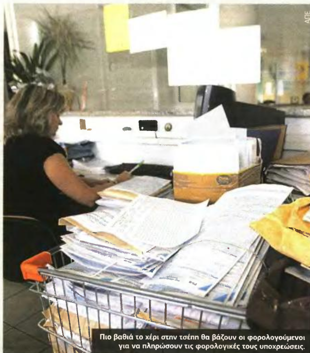
Πιο βαθιά το χέρι στην τσέπη θα βάζουν οι φορολογούμενοι για να πληρώσουν τις φορολογικές τους υποχρεώσεις.

Αυτή η αυτοτελής φορολόγηση προτείνεται να είναι ίδια και στους τόκους και στα μερίσματα μετοχών καθώς και να επεκταθεί και στις υπεραξίες από πωλήσεις ακινήτων, μετοχών και μερίδων αμοιβαίων κεφαλαίων, που σήμερα δεν φορολογούνται. ■