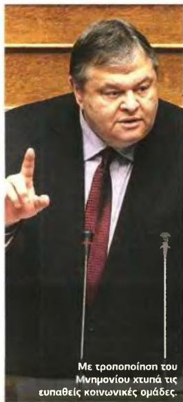
Με τροποποίηση του Μνημονίου χτυπά τις ευπαθείς κοινωνικές ομάδες.

η ελληνική κυβέρνηση φαίνεται να έχει δεσμευτεί για περικοπές κοινωνικών δαπανών όχι 1% του ΑΕΠ ή 2 δισ. ευρώ την τριετία 2013-2015, όπως αναφέρει το ψηφισθέν από τη Βουλή κείμενο, αλλά για περικοπές 1,5% του ΑΕΠ ή 3 δισ. ευρώ τη διετία 2013-2014.