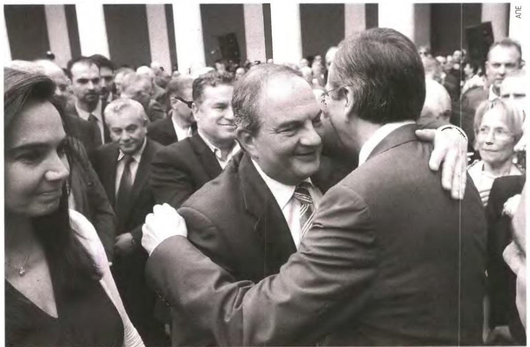
Θερμός εναγκαλισμός εν μέσω χειροκροτημάτων με τον Κώστα Καραμανλίδη.

Σε 9 άξονες το σχέδιο του προέδρου της Ν.Δ. για την επόμενη μέρα και έξοδο από το τούνελ