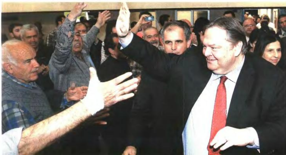
Δεν έκρυβαν τον ενθουσιασμό τους όσοι έδωσαν το «παρών» στην προεκλογική ομιλία του Βαγγέλη Βενιζέλου την περασμένη Παρασκευή