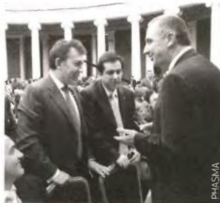
Ενθουσίασε το σχέδιο για έξοδο από την κρίση.