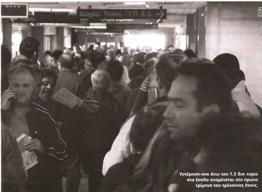
Υατέρηση-σοκ άνω του 1,5 δισ. ευρώ στα έσοδα αναμένεται στο πρώτο τρίμηνο του τρέχοντος έτους.