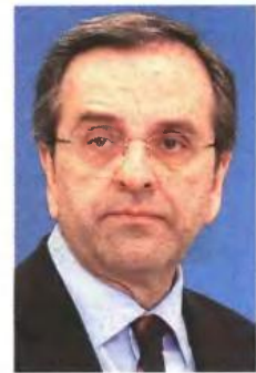
Μετά το PSI, επείγει η λήψη μέτρων για την ανακρίση και την ανάπτυξη της ελληνικής οικονομίας, επεσήμανε η Ν.Δ. με πρόεδρο τον κ. Αντώνη Σαμαρά.