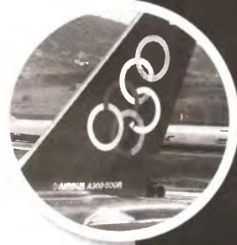
Στο υπ. Μεταφορών δεν δόθηκαν 230.159 € για καταχώριση κειμένου σχετικά με την αναγκαιότητα αποκρατικοποίησης της Ολυμπιακής.