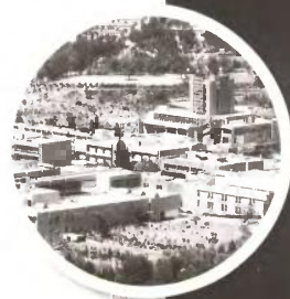
Το ΕΜΠ από... λάθος ζήτησε 300.000 ευρώ για τεχνικό έργο το οποίο όμως είχε εξοφληθεί.