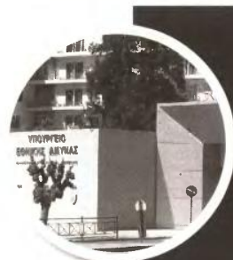
Επιστράφησαν στο υπ. Εθνικής Αμυνας χρηματικά εντάλματα ύψους 5,8 εκατ. ευρώ γιατί αφορούσαν μελλοντικά έξοδα.

• «Κόπικαν» εντάλματα 27.300 ευρώ στο ΙΚΑ Κυπαρισσίας σε αμοιβές γιατρον για εξετάσεις ασφαλισμένων γιατί αφορούσαν παρελθόντα έτη και δεν είχαν υποβληθεί εντός ενός μηνός.