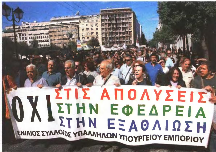
ΠΕΡΙΠΟΥ 30.000 εργαζόμενοι θα περάσουν στην ανεργία με βάση τις ρυθμίσεις του νομοσχεδίου για τον περιορισμό κατά 40% των δομών του κράτους

Οι διαβεβαιώσεις ωστόσο του κ. Ρέππα δεν περνούν. «Νοηδες» είναι οι δηλώσεις του κ. Πόουλ Τόμσεν που ζητεί μετ' επιτάσεως απολύσεις προσωπικού από το Δημόσιο, ενώ η κυβέρνηση έχει ήδη δεσμευθεί να απολύσει, το τρέχον έτος, 15.000 υπαλλήλους, καθώς και να μειώσει τον αριθμό των δημοσίων υπαλλήλων κατά 150.000 ως το τέλος του 2015. «Οι δεσμεύσεις αυτές», ανα-