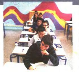
ΟΙ ΑΛΛΑΓΕΣ στο εξεταστικό αναβάλλονται για μετά τις εκλογές

ανώτατης εκπαίδευσης και να λύσουν μια σειρά διαδικαστικά προβλήματα που έχουν προκύψει. Οι τροπολογίες αυτές επρόκειτο να κατατεθούν σε ένα από τα νομοσχέδια που συζητούνται αυτή την περίοδο στη Βουλή. Ωστόσο, προκειμένου να διαφυλαχθεί το «ήρεμο» κλίμα της προεκλογικής περιόδου και να μην ξεκινήσουν νέες αναταραχές, τελικά δεν κατατέθηκαν. Η μόνο τροπολογία που «περνάει» τις επόμενες ημέρες είναι εκείνη που αφορά τις ενεργειακές διατάξεις για τους τρέκλους και τα πολυτεχνικά και την εισαγωγή τους σε πανεπιστήμια και ΤΕΙ.