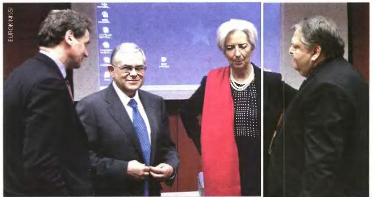
Παπαδήμος και Βενιζέλος συμφώνησαν με Τόμσεν και Λαγκάρντ, ερίτηνη του ελληνικού λαού και των πολιτικών κομμάτων, στην επιβολή πρόσθετων μέτρων.

καλύπτει το κείμενο της έκθεσης του ΔΝΤ για τα νέα επίδομα δημοσιονομικά μέτρα τα οποία πρέπει να ληφθούν μέχρι το 2014, σύμφωνα με τα σχέδια που εκπόνησαν -ερίτηνη του ελληνικού λαού- η Τρίκα και ο κ. Παπαδήμος και Βενιζέλος.