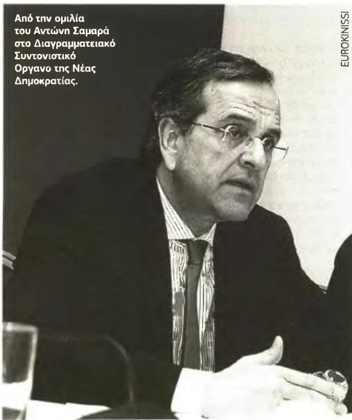
Από την ομιλία του Αντώνη Σαμαρά στο Διαγραμματειακό Συντονιστικό Όργανο της Νέας Δημοκρατίας.

Ο πρόεδρος της Ν.Δ., που έχει πολλές φορές χαρακτηρίσει το μέτρο αυτό άδικο, ξεκαθάρισε πως, επειδή η πλήρης εφαρμογή μιας τέτοιας πρότασης προϋποθέτει την ύπαρξη περιουσιολογίου, μέχρι να φτιαχτεί το περιουσιολόγιο, η Ν.Δ. μελετά άλλους τρόπους για να αντικατασταθεί το χαράτσι με φόρους τύπου ΕΤΑΚ. «Ετσι κι αλλιώς, το χαράτσι μόνο προσωρινό είναι και πρέπει να αντικατασταθεί με άλλο ισοδύναμο. Που θα δημι-