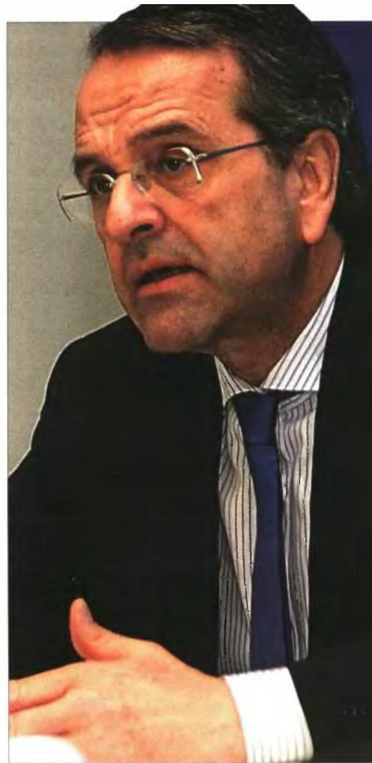
▲ Ο Αντώνης Σαμαράς στη χθεσινή συνεδρίαση του Διαγραμματικού Συντονιστικού Οργάνου της Νέας Δημοκρατίας

Εν πάση περιπτώσει, επαναλαμβάνω ότι είμαστε αντίθετοι σε οριζόντιες περικοπές, σε μέτρα δηλαδή τα οποία μειώνουν μισθούς και συντάξεις. Αυτά τα μέτρα φέρνουν πάντοτε ύφεση, οδηγούν στο αντίθετο αποτέλεσμα, το είδαμε και το ζήσαμε. Υπάρχει δέσμευση να δούμε τη μακροχρόνια χρηματοδότηση των ασφαλιστικών μας ταμείων, πράγμα για το οποίο έχουμε ήδη προτείνει να πάρουν πόρους από τη δημόσια περιουσία».