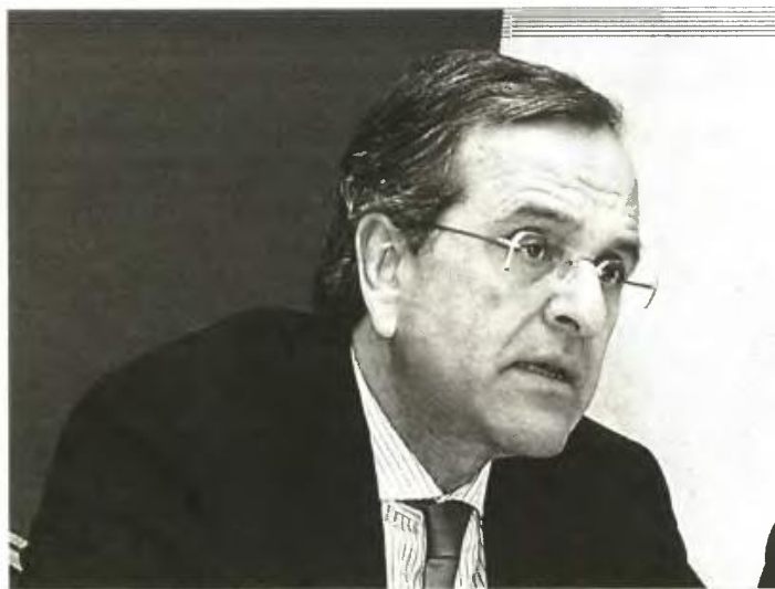
▲ ΓΙΑ ΤΑ ΚΕΝΤΡΑ κράτησης παράνομων μεταναστών ο Αντ. Σαμαράς τάχθηκε υπέρ του διαλόγου με τις τοπικές κοινωνίες

Ο πρόεδρος της ΝΔ, ο οποίος με την ομιλία του χθες στη συνεδρίαση των γραμματειών του κόμματος, κράτησε «ψηλά» στην προεκλογική ατζέντα τα θέματα «νόμου και τάξης» με αιχμή τη λαθρομετανάστευση, έδωσε υποσχέσεις για καταργήσεις φόρων και επιστροφές χρημάτων σε συγκεκριμένες κοινωνικές ομάδες, αλλά στο ρητορικό ερώτημα που έθεσε για την εξεύρεση των σχετικών κονδυλίων,