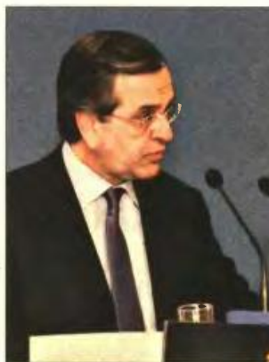
» Αντ. Σαμαράς

ΚΑΤΑΡΓΗΣΗ ΕΤΑΚ » Ο κ. Σαμαράς επανέλαβε ότι στόχος του είναι να καταργήσει το ενιαίο τέλος ακινήτων, που πληρώνεται μέσω των λογαριασμών της ΔΕΗ και «να το αντικαταστήσουμε με έναν ενιαίο φόρο για τα ακίνητα, που θα είναι πιο δίκαιος και αποτελεσματικός». Αυτό όμως, πρόσθεσε «προϋποθέτει ενιαίο περιουσιολόγιο, που δεν υπάρχει και μέχρι τότε θα επιβληθεί ένας φόρος ακινήτων τύπου ΕΤΑΚ». Αναφερόμενος στο θέμα των συντάξεων υποστήριξε ότι δεν υπάρχει δέσμευση, απέναντι στην τρόικα για μείωση των συντάξεων, σημειώνοντας ότι «εμείς επεξεργαζόμαστε ισοδύναμα μέτρα και αντίθετα η μόνη δέσμευση που έχουμε αναλάβει είναι ότι θα αποκαταστή-