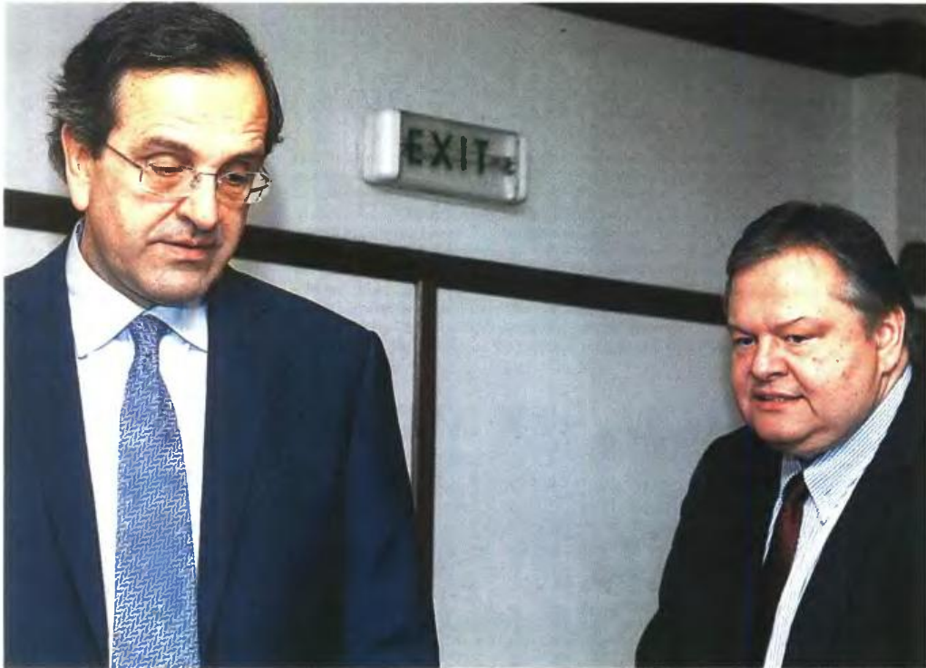
Αντώνης Σαμαράς και Βαγγέλης Βενιζέλος με έκδηλη τη μεταξύ τους αμφικνία σε φωτογραφία αρχείου. Χθες ο νέος πρόεδρος του ΠΑΣΟΚ μιλώντας ενώπιον της εθνικής εκλογικής επιτροπής