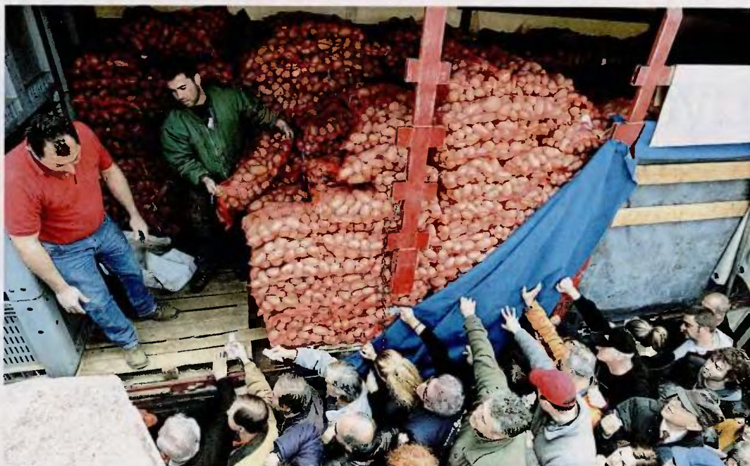
Παραγωγοί και καταναλωτές βρήκαν σημείο επαφής, προς απογοήτευση των μεσαζόντων. Και η μάχη της πατάτας άρχισε...

Καθώς σε εφημερίδες και κανάλια όλοι αναρωτιούνταν μήπως φυτρώνουν παραισθησιογόνους πατάτες στον Περισσό, τα άλλα κόμματα βρήκαν την ευκαιρία να κάνουν τους συντρόφους του ΚΚΕ πουρ. «Λαμπρό παράδειγμα αυτοοργάνωσης» είδε ο