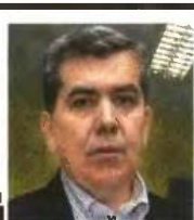
Γράφει ο ΑΛΕΞΗΣ Π. ΜΗΤΡΟΠΟΥΛΟΣ*

www.amitrakopoulos.gr, a-mitrop@otenet.gr