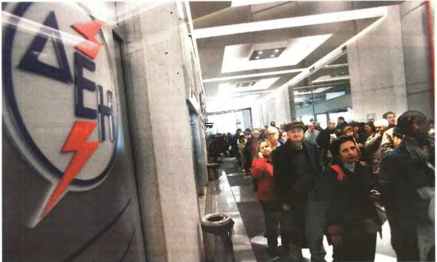
Μετά την απόφαση του Συμβουλίου της Επικρατείας εκατοντάδες καταναλωτές στα πρακτορεία της ΔΕΗ επιχειρήσαν να πληρώσουν μόνο το ρεύμα, για να διαπιστώσουν όμως τελικά ότι εξοφλούν το χαράτσι για τα ακίνητα.