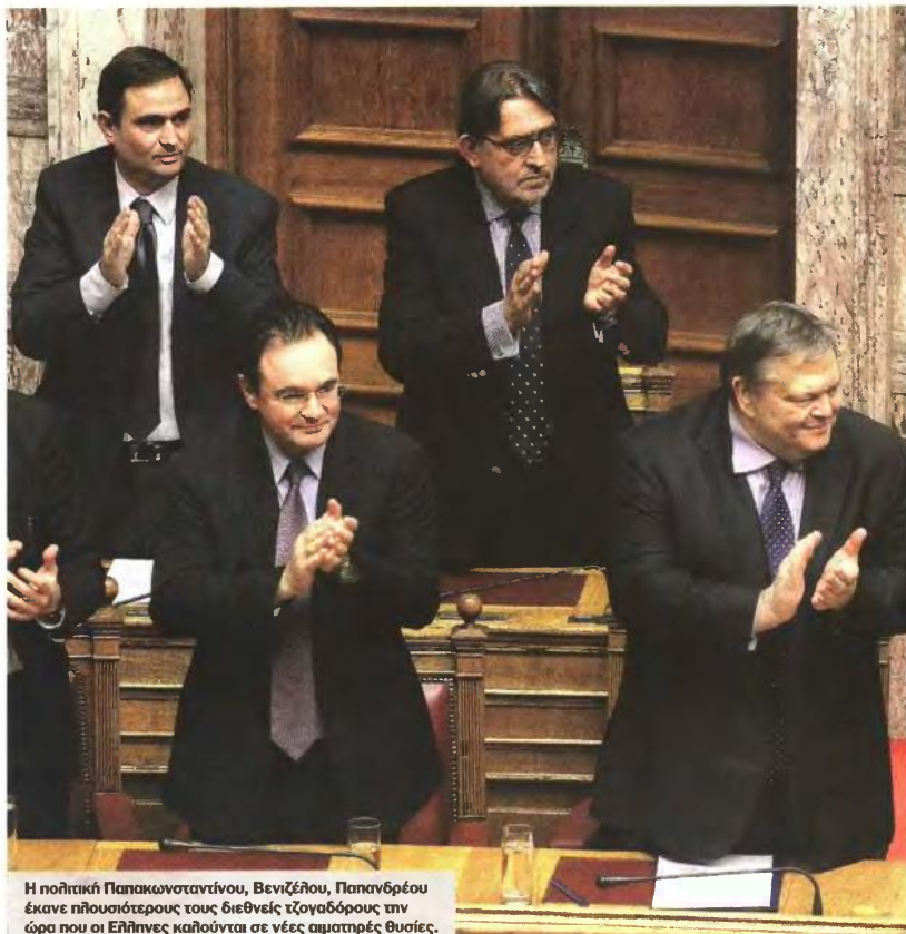
Η πολιτική Παπακωνσταντίνου, Βενιζέλου, Παπανδρέου έκανε πλουσιότερους τους διεθνείς τζογαδόρους την ώρα που οι Έλληνες καλούνται σε νέες αιματηρές θυσίες.

Πριν κοπάσουν οι κυβερνητικές θριαμβολογίες για την απομείωση του δημόσιου χρέους κατά 105-110 δις. ευρώ (από τα οποία, όμως, μόνο 55-60 δις. ευρώ θα απομείνουν ως καθαρό όφελος) και προτού καλά καλά στεγνώσει το μελάνι του Φύλλου της Εφημερίδας της Κυβερνήσεως όπου δημοσιεύθηκε η Πράξη Υπουργικού Συμβουλίου για τη χρησιμοποίηση των CACs, η αρμόδια επιτροπή της ISDA αποφάνθηκε ομόφωνα ότι συντρέχουν οι προϋποθέσεις κήρυξης πιστωτικού γεγονότος. Ορισε δε ως ημερομηνία δημοσίευσης για την πληρωμή των ασφαλιστρών κινδύνου τη 19η Μαρτίου. Η επιστράτευση των ρητρών συλλογικής δράσης για να επιτευχθεί σχεδόν καθολική συμμετοχή των ιδιωτών ομολογιούχων στην ανταλλαγή των ελληνικών κρατικών τίτλων και η συνεπακόλουθη πυροδότηση πιστωτικού γεγονότος επιβεβαίωσαν πλήρως τις σχετικές εκτιμήσεις που είχε κάνει ο «Ε.Τ.» από την