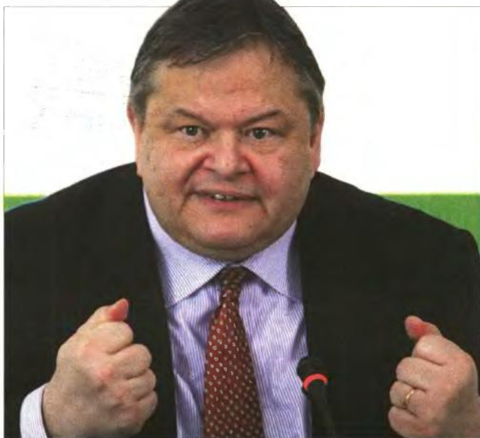
▲ Ο Ευ. Βενιζέλος σφημεμένος χθες στη συνέντευξη Τύπου που έδωσε στην οχυρωμένη Ιπποκράτους

Χαρακτηριστικό πάντως για τη δημοτικότητα του κ. Βενιζέλου είναι ότι τα ποσοστά τηλεθέσης σε συνέντευξή του την προηγούμενη το βράδυ ήταν πιο απογοητευτικά και από του ΠΑΣΟΚ. Αυτό συγκεντρώνει περίπου 11%, ενώ ο κ. Βενιζέλος... 6%.