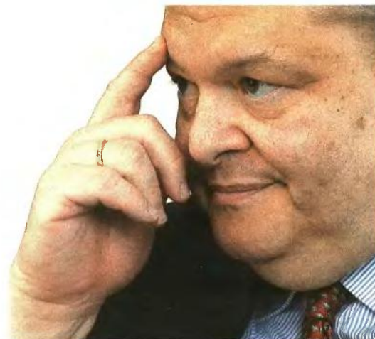
Ο Βενιζέλος χθες κατά τη συνέντευξη Τύπου στην Ιπποκράτους

Ο υποψήφιος πρόεδρος του ΠΑΣΟΚ χρησιμοποιεί προσωπικούς τόνους επιδιώκοντας να απαντήσει γιατί οι ψηφοφόροι θα πρέπει να τον εμπιστευθούν στις εθνικές εκλογές. «Ο καθένας έχει τη διαδρομή του. Εγώ δεν προέρχομαι από έναν κομματικό μηχανισμό. Δεν γεννήθηκα μέσα στην πολιτική ούτε γεννήθηκα υπουργός Οικονομικών... Γεννήθηκα στη Δυτική Θεσσαλονίκη, στους Αμπελοκήπους, σε μία οδό που έφερε ένα όνομα που κατάλαβα τη σημασία του πολλά χρόνια αργότερα, στην οδό Ελευθερίας. Εχω φοιτήσει σε δημόσια σχολεία και έχω έρθει στην πολιτική από την οποία στην πραγματικότητα ποτέ δεν έφυγα, γιατί και ως παιδί στην πολιτική ήμουν».